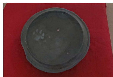
見野の郷交流館に展示されている猫と思われる動物の足跡の付いた須恵器のレプリカ