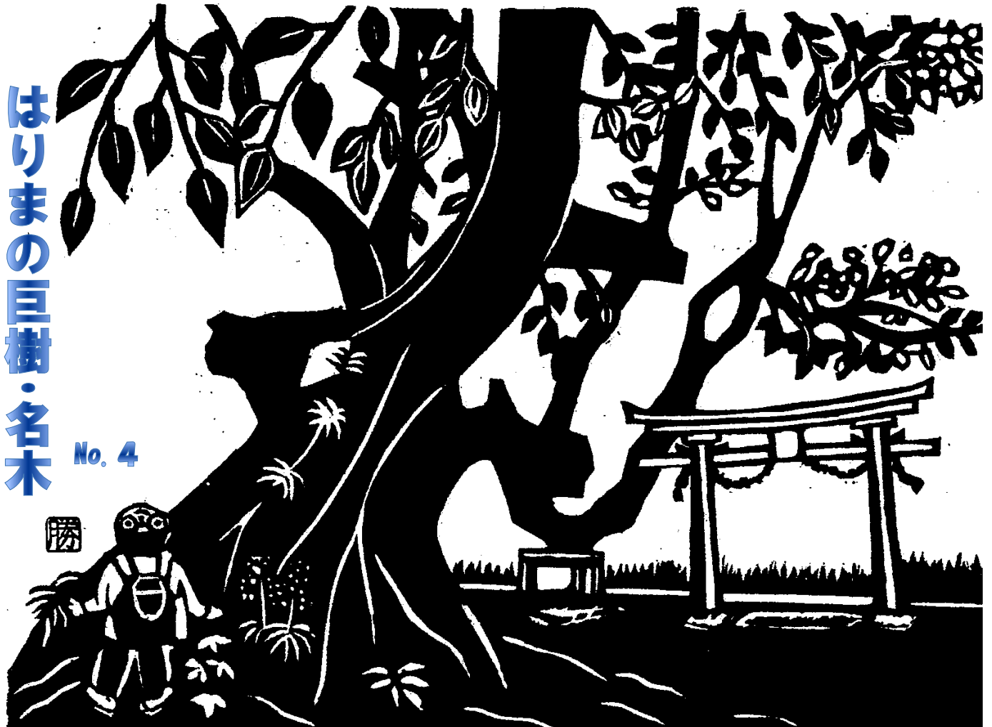
ムクノキ（天満神社）

しんぶんを通して、人のWa'・平和のWa'・話のWa'など限らないWa'に出会いたい…そんなWa'を伝えていきます。 (生活創造応援隊 一同)