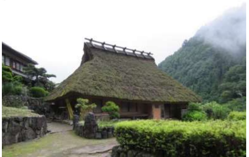
古井家住宅（千年家）

スギやヒノキの骨組みに表面を稲穂で覆って作られ、鳥居の上に設置される6メートルの巨大な申の干支は、年末から3月末までの設置とのことで、見る事が出来ず残念でしたが、楽しい取材プチ旅行となりました。