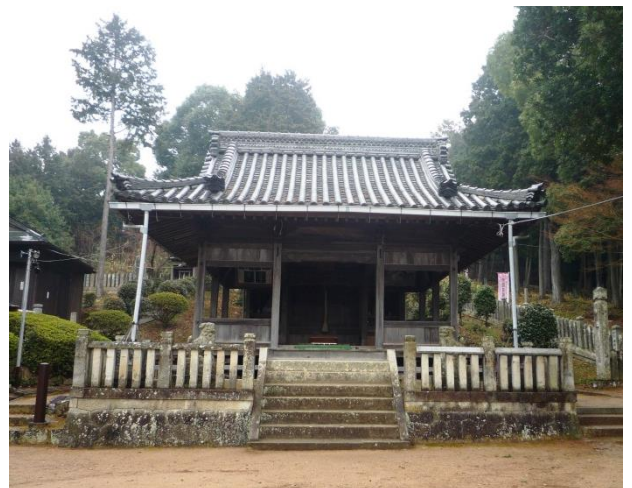
《 鈴ノ森神社 拝殿 》