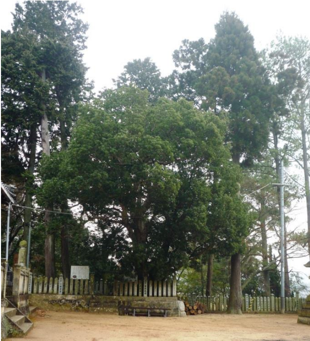
《 やまももの木 》

それは立っていると言うよりは、どっしりと地面に腰を下ろしているという風情で、近づいてみると、象の肌のような樹皮が風雪に耐えた歳月を感じさせます。