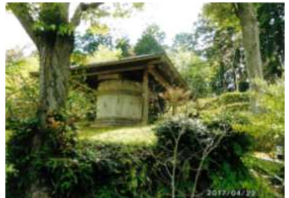
《 昔の醤油樽 》～中に入れます