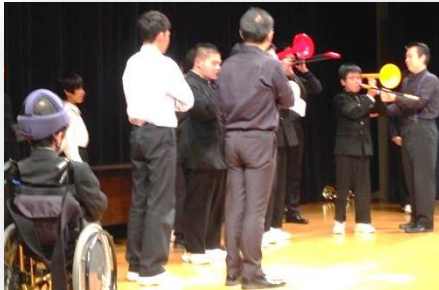
トロンボーン奏者から 演奏指導を受ける中学生

コンサートに足を運ぶのが難しい方たちのために、病院や施設を訪問したり、コンサート会場に来ていただいたりして、プロの演奏者による音楽を生で聴いていただく活動を行っています。お客様にはご自分のペースで演奏を聴いていただいています。たとえば、疲れたら演奏中に退席することができます。また、演奏中に自分の気持ちを声や行動（立ち歩き等）で表現していただいても結構です。