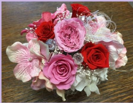
プリザーブドフラワーの作品

そして最後のメンバーは、長く花を楽しむことができるプリザーブドフラワーの講師。各地でアレンジ教室を行い、イベントなどで作品の販売や体験教室をしています。