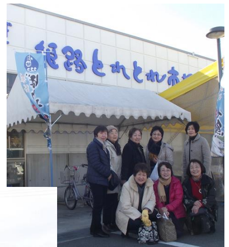
【JF ぼうぜ 姫路とれとれ市場】の前でパチリ😊