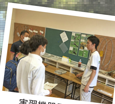
実習機器展示説明