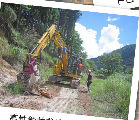
高性能林業機械操作体験