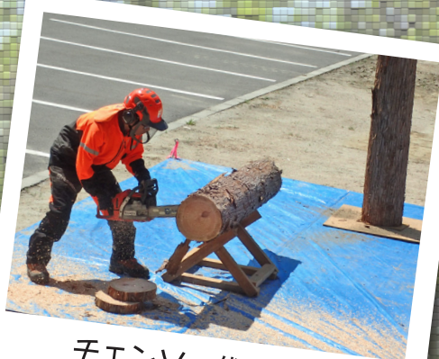
チェーンソー伐木実演