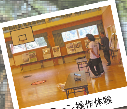
ドローン操作体験