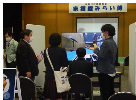
第1回東播磨みらい博(R2)

地域でのスマートシティ推進に対する県民参加意識の一層の高揚を図り、スマート技術を活用した地域格差の是正等につなげるため、次世代技術を体験する「東播磨みらい博」を開催する。