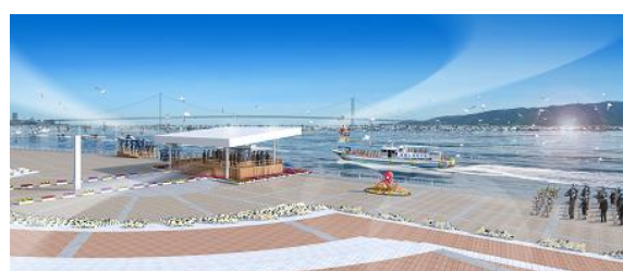
全国豊かな海づくり大会(イメージ)

海の豊かさを守るため、漁業者による海底耕うんや海浜清掃に加え、 新たに遊漁者等と協力した小型タコの放流や産卵用タコツボの設置を支援。 大会の開催に合わせ、全国からの来場者や近隣住民に飲食店等にて旬の美味しい魚をPRする。