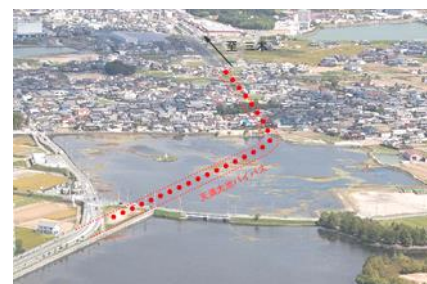
天満大池バイパス

東播磨道(北工区)の整備、国道2号(加古川市)の4車線化・対面化、天満大池 バ イパス、相生橋西詰交差点改良整備の推進、自転車レーンの整備(高砂市役所周辺)