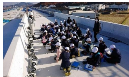
東播磨道現場見学会(小学校3年生)

東播工業高校の生徒を対象にした工事現場でのインフラ整備体験(インターンシップ)に加え、 地元の小学校、中学校、高等学校の生徒を対象に、「(仮称)“東播磨道”建設現場まるごと見学ツアー」を実施し、実際の工事現場で社会基盤整備の知見を深める機会を提供することにより、地元で将来活躍したいと考える人材の増加を図る 。