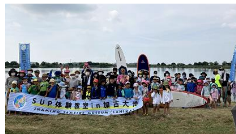
SUP 体験教室 in 加古大池

ため池と企業・団体とのコラボイベントなど 20 周年記念事業を実施する。メインイベントとして、令和 4 年 11 月頃、寺田池（加古川市）などで『 ため池×ウェディング 』、『 ため池×能 』などを実施する。