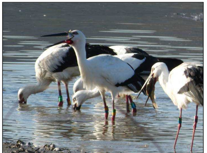
2020年11月13日 加古川市志方町深志野池