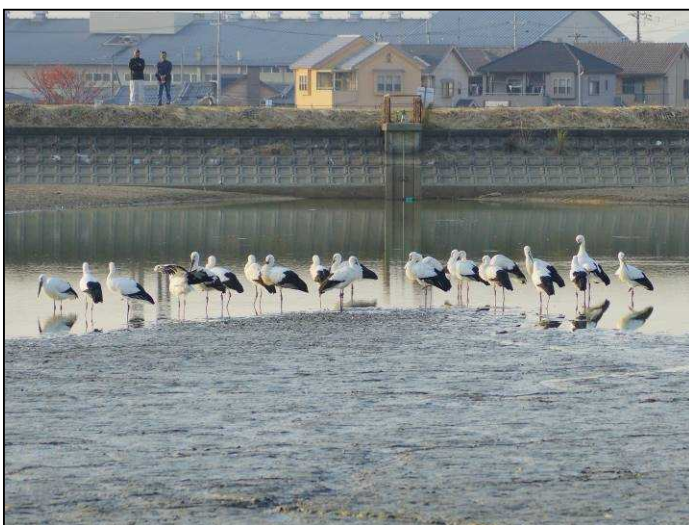
2020年11月16日 稲美町和田上池