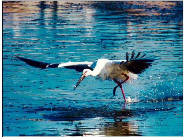
2020年10月25日 明石市大久保町片淵池