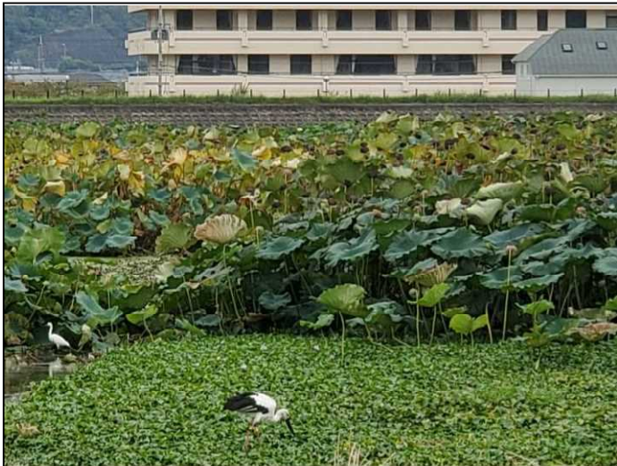
2020年9月24日 高砂市阿弥陀町皿池