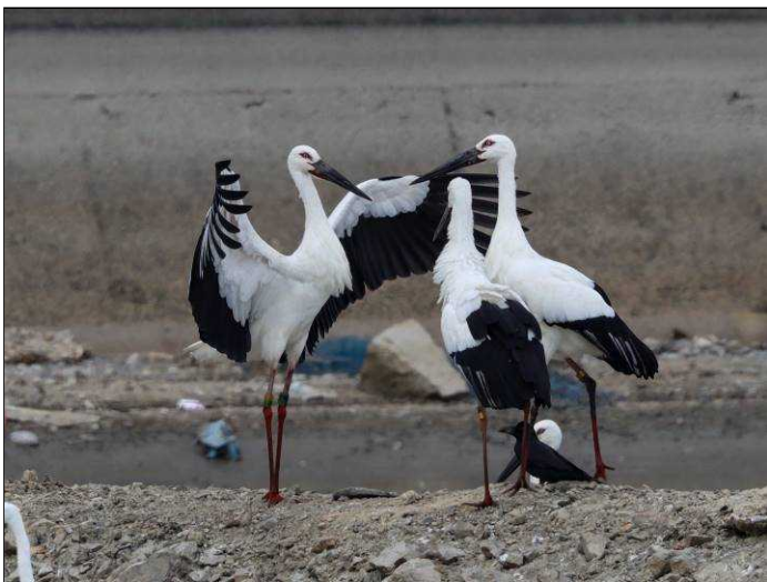
2020年11月1日 稲美町天満大池