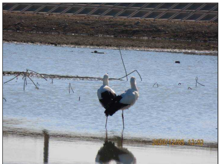
2020年12月5日 加古川市志方町原皿池