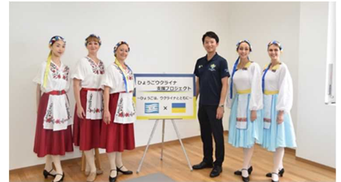
ウクライナ避難民支援にかかる現地視察