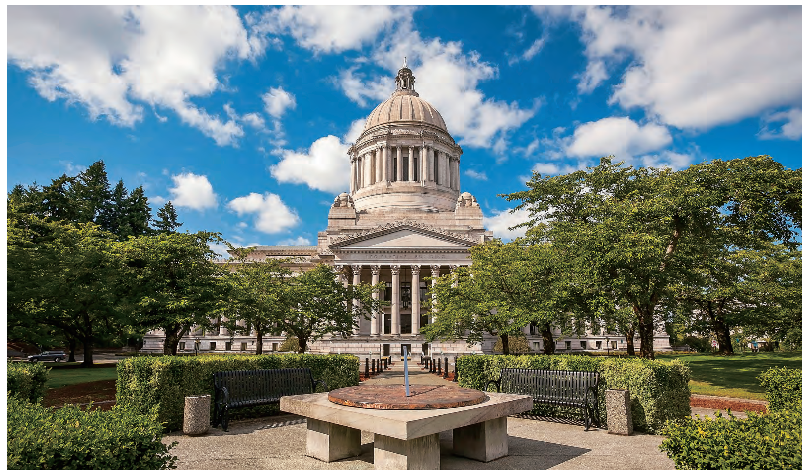
ワシントン州議会議事堂 (オリンピア市) Washington State Capitol (Olympia)