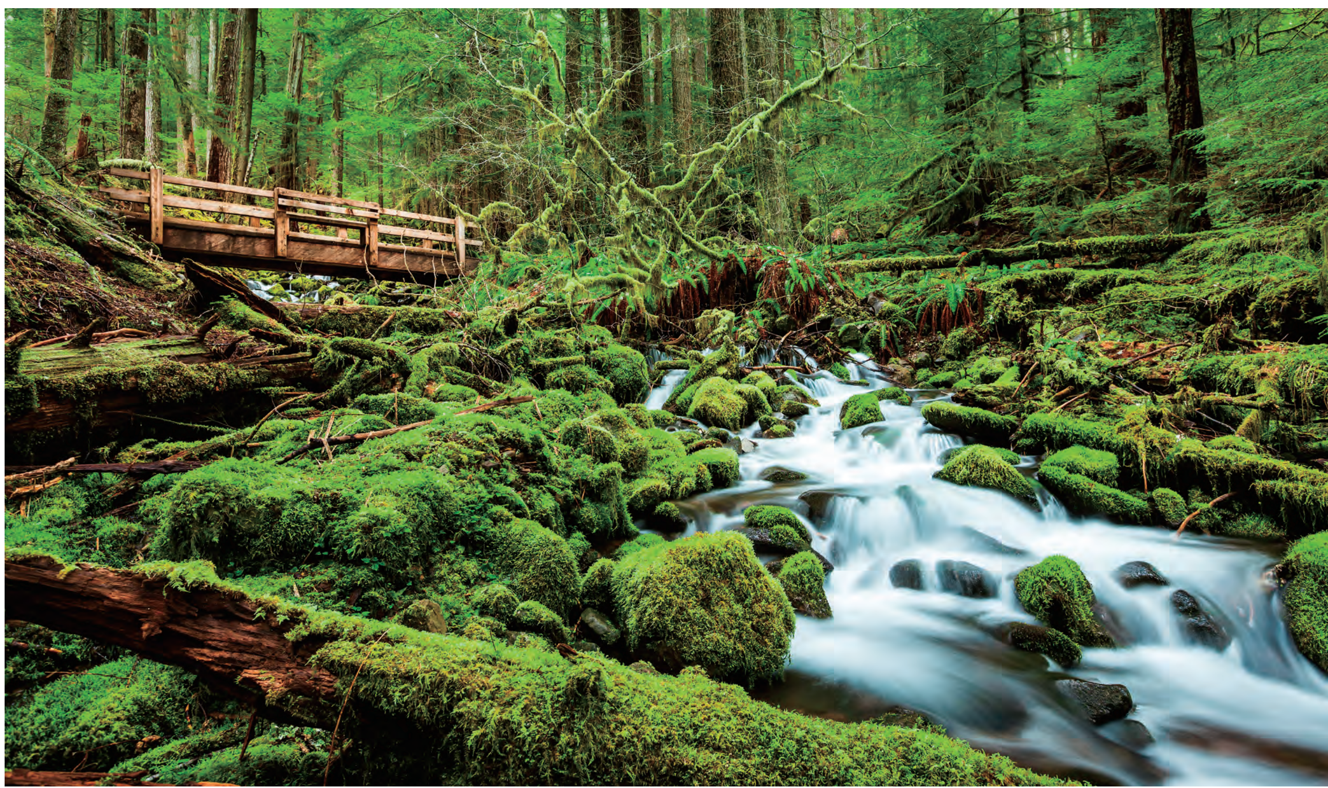
オリンピック国立公園 Olympic National Park