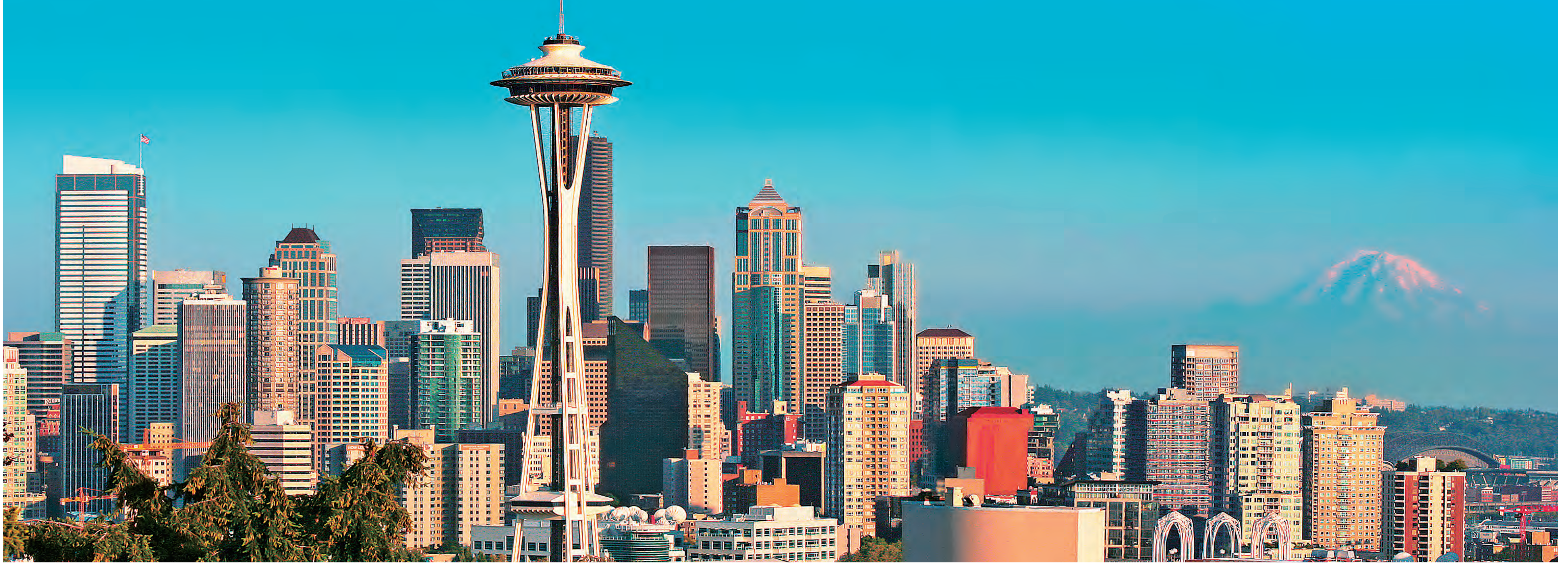
シアトル市街地 Seattle city landscape