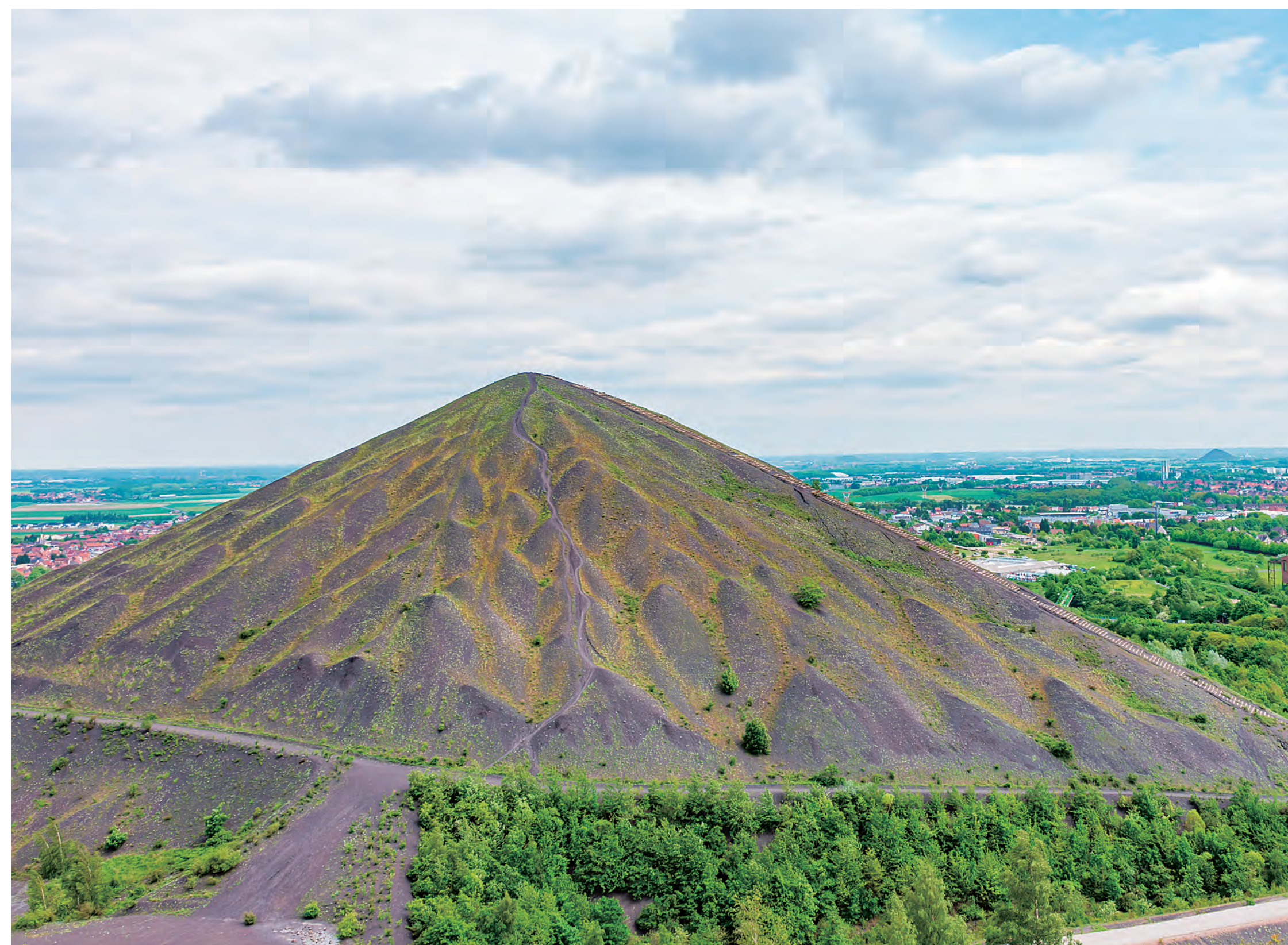
ノール=パ・ド・カレール鉱山盆地 Nord-Pas de Calais Mining Basin