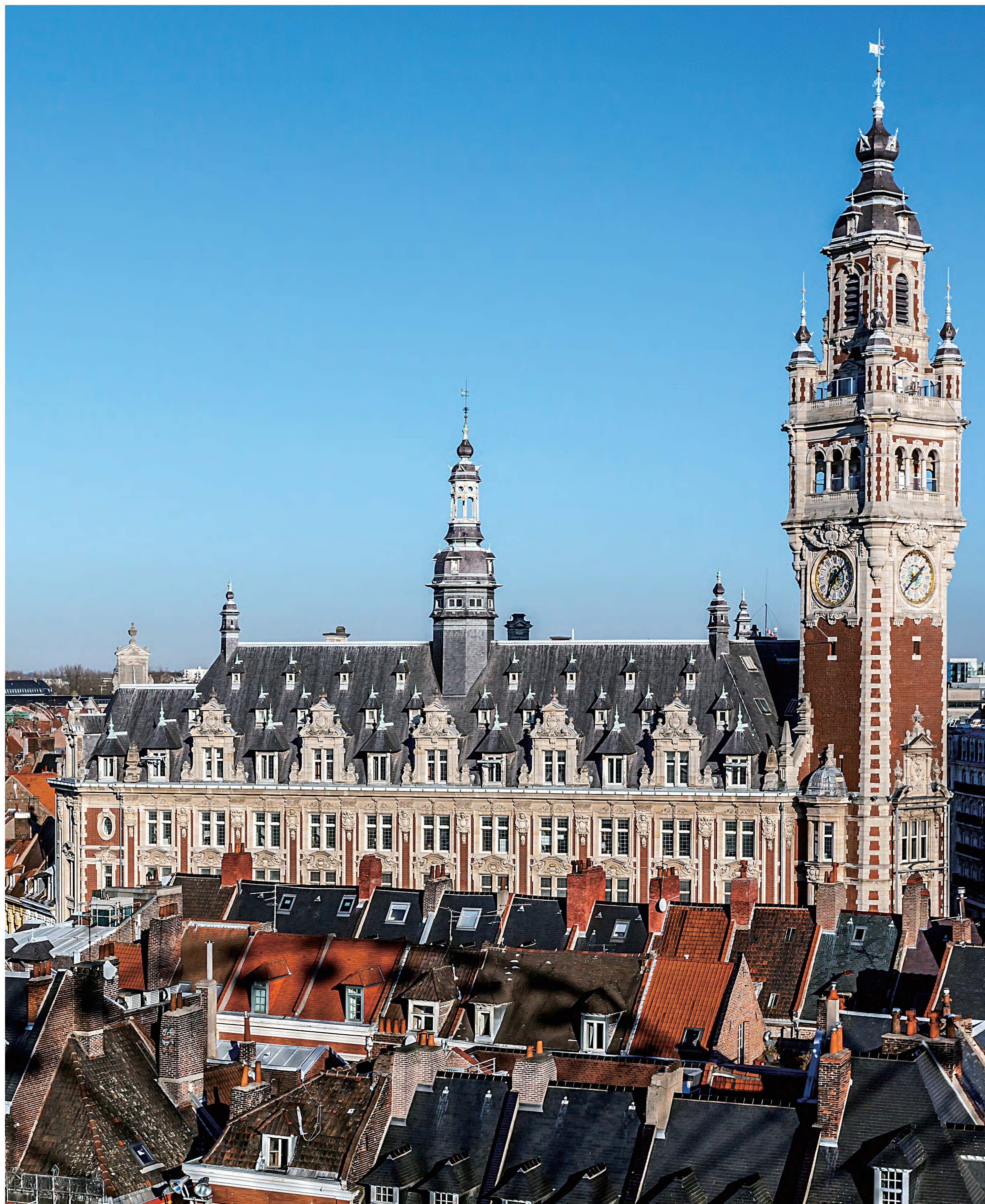
フランドル建築の街並み(リール) Streetscape with Flemish architecture (Lille)