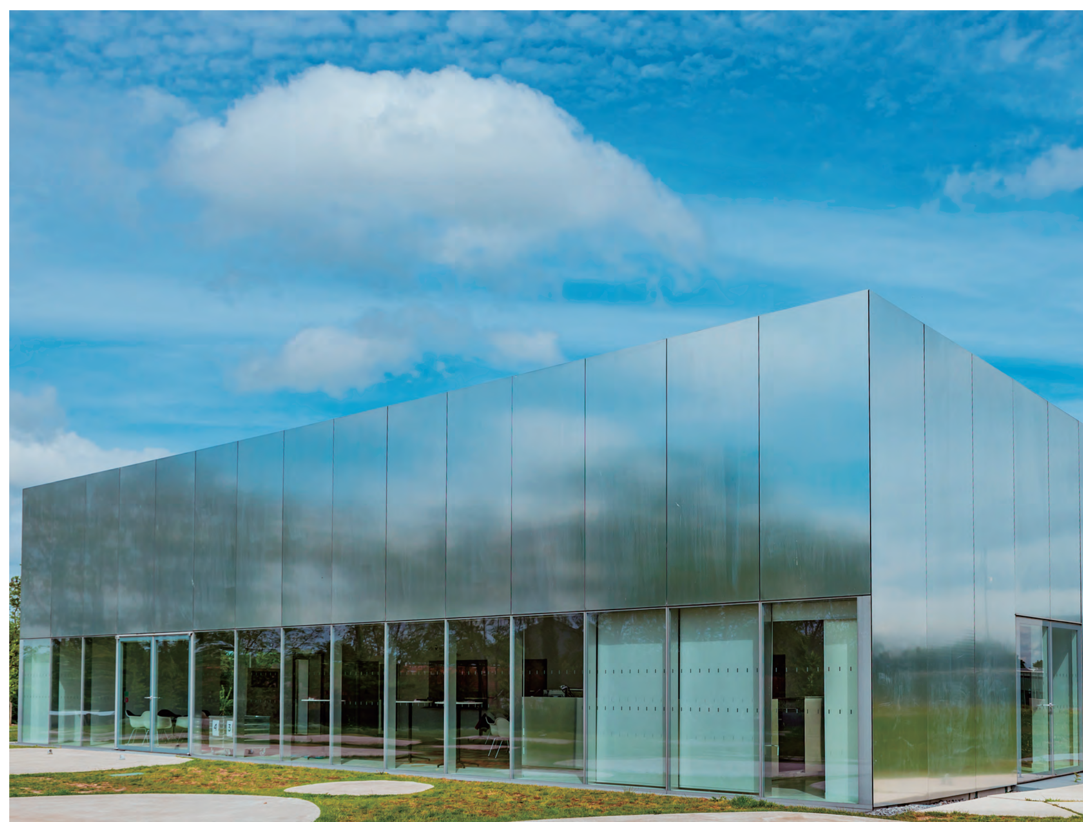
ルーヴル美術館ランス別館(ルーブル・ランス) Louvre-Lens