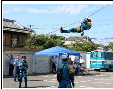
【災害救助訓練の展示】