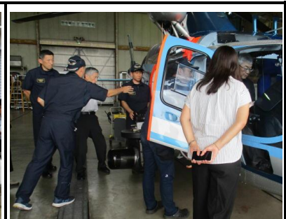
【航空隊施設・ヘリの見学】