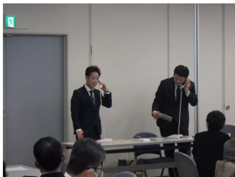
【県警察の取組紹介(自動通話録音装置)】

警察本部において警察署協議会代表者による全体会議を開催し、県警察の業務や取組について紹介するとともに、代表者相互の意見交換を行い、各協議会の取組や活動事例の共有を図るなど警察署協議会の更なる充実に努めている。