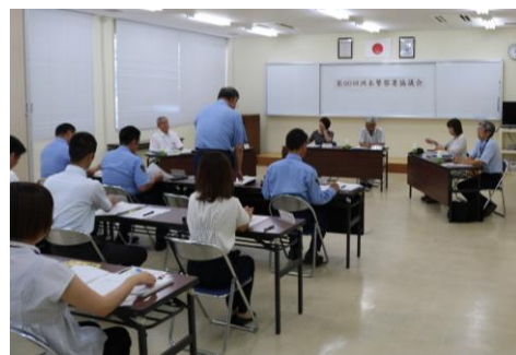
【洲本警察署協議会の開催状況】