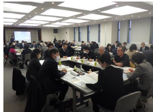
【代表者相互の意見交換】