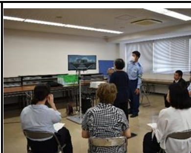
【交通安全シミュレーター体験】