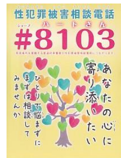
【#8103（ハートさん）ポスター】

また、殺人、傷害、性犯罪を始めとする身体的な犯罪や、死亡事故を始めとする一定の交通事故の被害者等に対して、刑事手続の流れや犯罪被害給付制度の概要、相談窓口などの情報を盛り込んだ「被害者の手引」を交付するとともに、臨床心理士等の資格を有する被害者支援カウンセラーや委嘱相談員によるカウンセリングを行うほか、相談窓口や各種支援制度を教示するなど、きめ細かな支援を推進している。