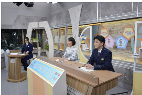
【テレビ広報番組「こんにちは県警です」】

また、県下15警察署では、地元ケーブルテレビ局を活用し、地域住民に対して、防犯や交通事故防止などの身近な情報を発信している。