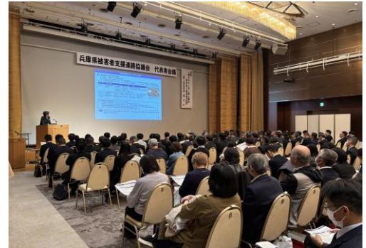
【兵庫県被害者支援連絡協議会】

県や市のほか、医師会や弁護士会等被害者支援に係る関係機関・団体が相互に協力し緊密な連携を図るため、ネットワークを構築し、それぞれの専門分野についての情報交換や被害者支援に関する広報啓発活動などを行っている。