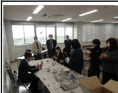
【インターンシップ生の参加】