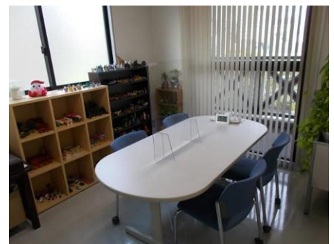
【カウンセリングルーム】

同支援室は、犯罪被害者等からの各種相談を受理しているほか、臨床心理士等の資格を有する職員によるカウンセリングを行っており、犯罪被害者等が訪問しやすいよう警察本部庁舎外に設置するとともに、安心感を与えやすい環境の整備に努めている。