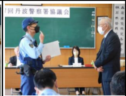
【模擬巡回連絡の実施】