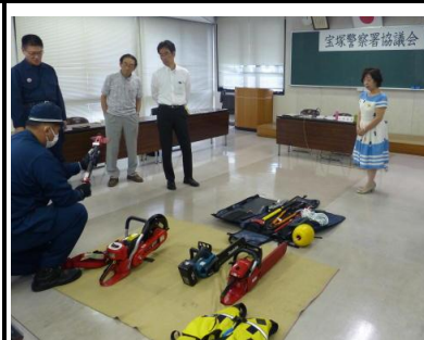
【災害救助工具の展示】