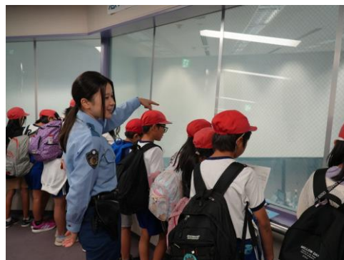
【警察本部の庁舎見学の状況】