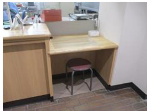
【警察署窓口（宍粟警察署）】