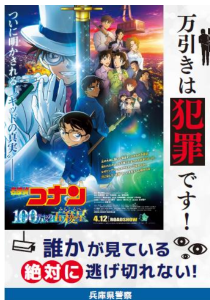
【タイアップポスター】