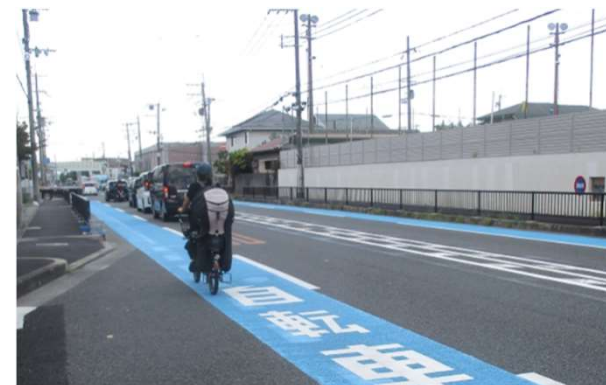
県道 山本伊丹線（伊丹市）