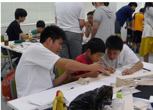
小中学生向け建設業体験会の実施

小中学生向け建設業体験会や工業高校生等を対象とした建設業魅力説明会などを開催し、建設業のイメージアップや若年者の入職促進等を推進する。