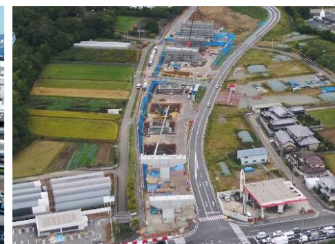
神戸西バイパス（神戸市西区）