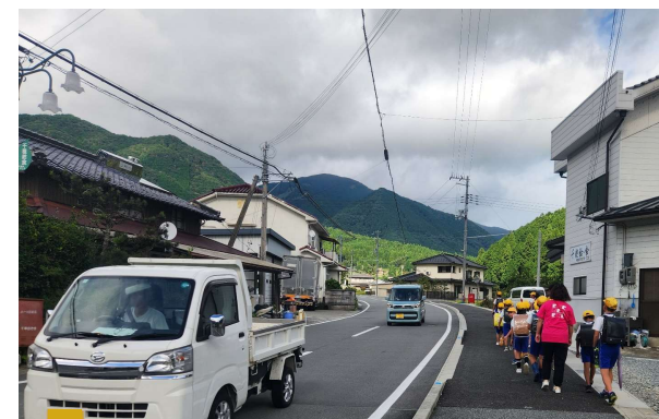
国道429号 千草Ⅰ（宍粟市）