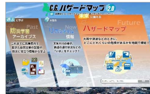
兵庫県CGハザードマップ（HP）

河川やダム、水門等の増水状況を視認できるよう、河川ライブカメラの画像を県HP等で発信している。