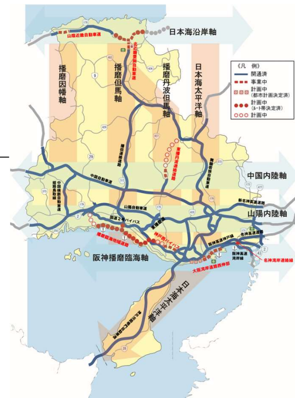
高規格道路ネットワーク図