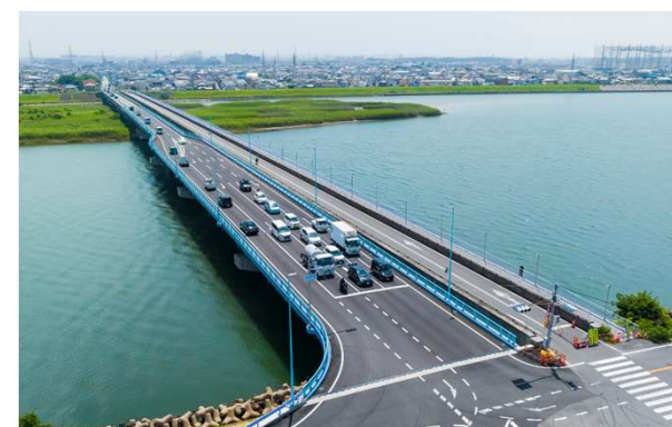
県道 明石高砂線 相生橋西詰交差点（高砂市）