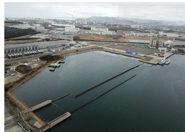
姫路港広畑地区（姫路市）