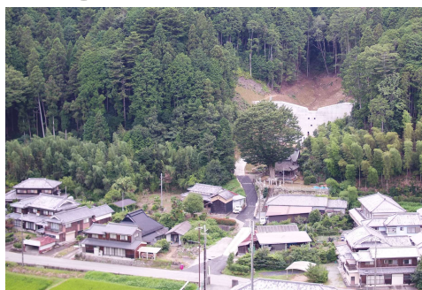
西山川 砂防堰堤（市川町）