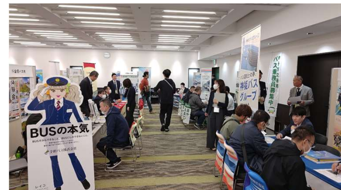
バス運転士合同就職説明会

公共交通事業者が行う人材確保にかかる取組を促進するため、第2種免許等の取得費用、ドライブレコーダー導入等の経費を支援する。