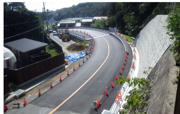
県道 川西篠山線 屏風岩 (猪名川町)