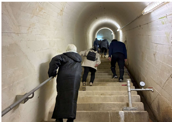
西播磨インフラツアー（小学生・保護者）