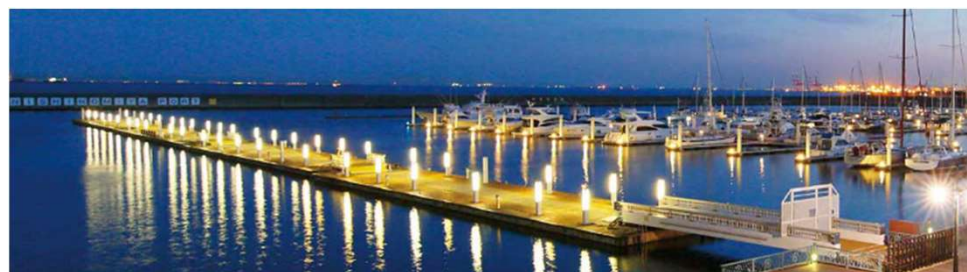
新西宮ヨットハーバー（西宮市）