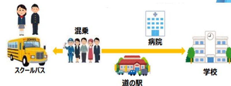
教育分野と交通の連携（スクールバスの混乗）