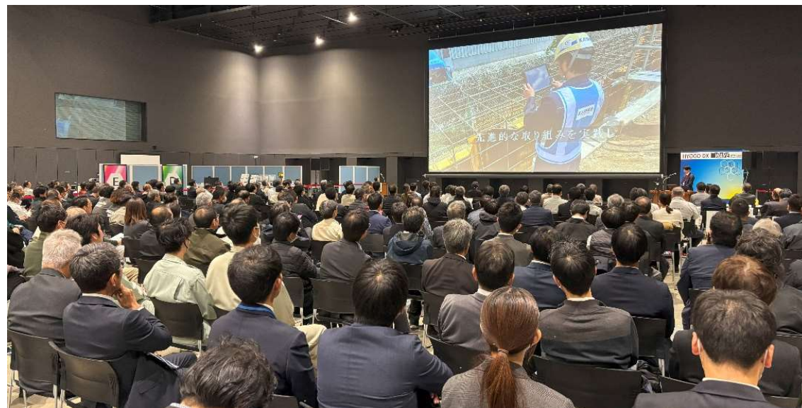
HYOGO DX WAVE 2025 インフラDXフォーラム（姫路市）の開催状況