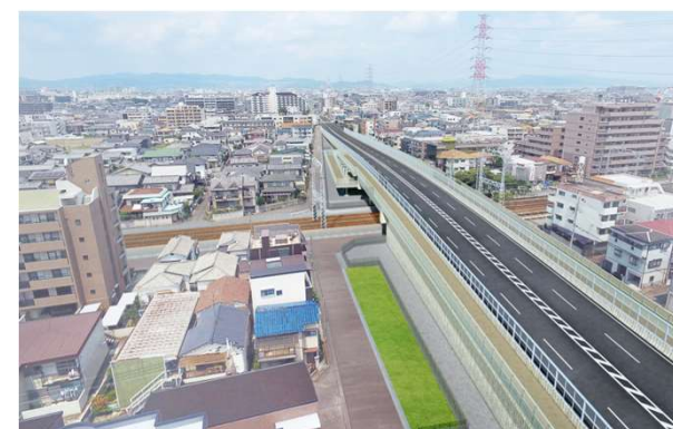
都市計画道路 尼崎宝塚線 阪急立体（尼崎市）