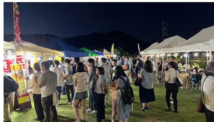
久下村夜市（R7.8.22 久下村駅）