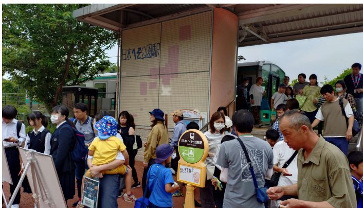
北播磨かんきょうフェスタ（R7.6.8 日本へそ公園駅）

通勤・通学、通院、買物等の日常生活や観光・交流による地域活性化に欠くことのできないJRローカル線を維持・活性化するため、「JRローカル線維持・利用促進協議会」と路線ごとの「ワーキングチーム」において、市町等と連携しながら利用促進策を推進する。