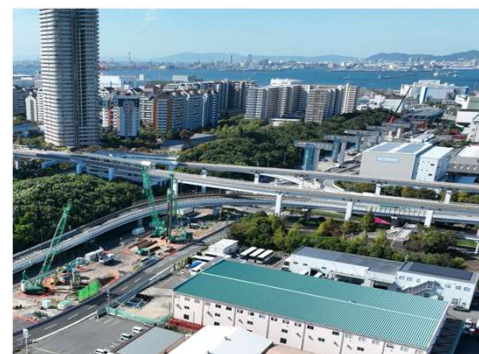
大阪湾岸道路西伸部（六甲アイランド）