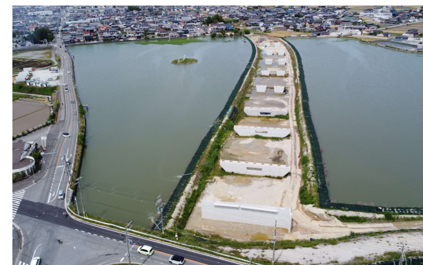
県道 宗佐土山線 天満大池バイパス (稲美町)