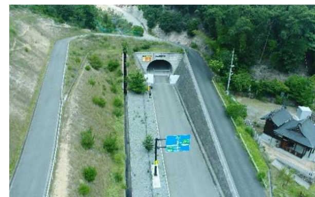
県道 広畑青山線 夢前川右岸線 (姫路市)