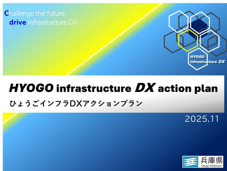
インフラDXアクションプラン（表紙）