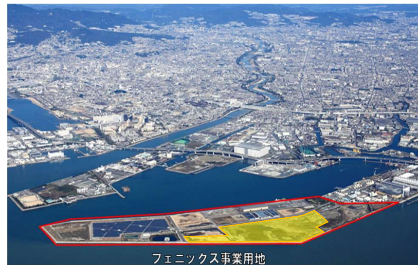
フェニックス事業用地 フェニックス事業用地（分譲予定地）