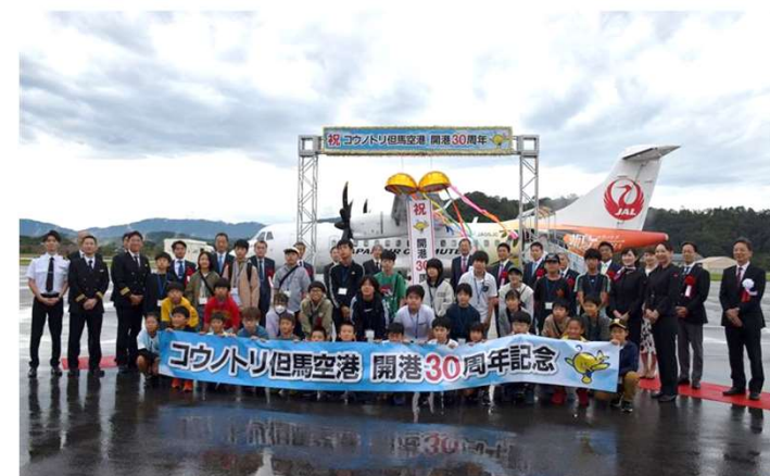
コウノトリ但馬空港 開港30周年記念セレモニーの様子