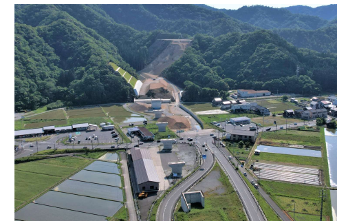
山陰近畿自動車道 浜坂道路Ⅱ期（新温泉町）