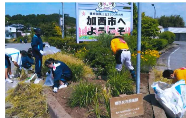
県道 多可北条線（加西市）