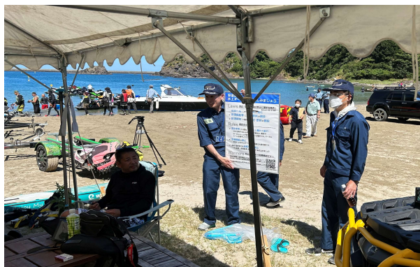
合同パトロールの実施（諸寄海岸）