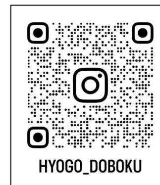
土木部アカウント QRコード