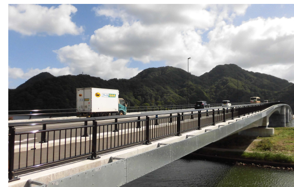
県道 豊岡竹野線 城崎大橋（豊岡市）