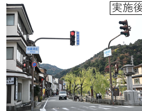
県道 豊岡竹野線 II 工区 (豊岡市)