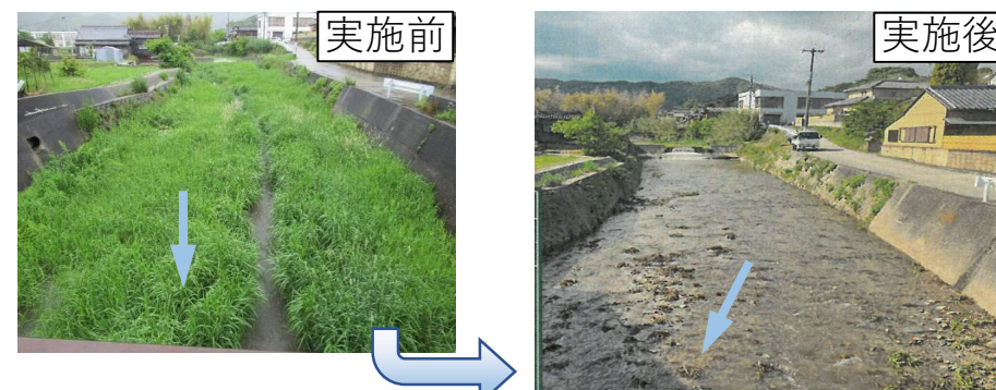
生穂川 堆積土砂撤去（淡路市）