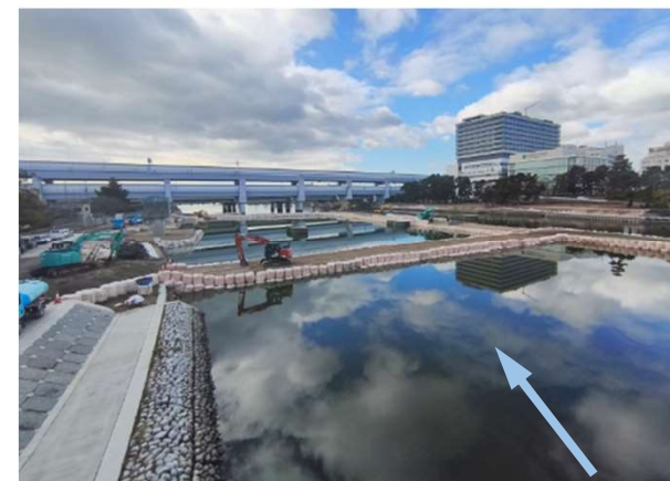
武庫川 潮止堰撤去（尼崎市等）