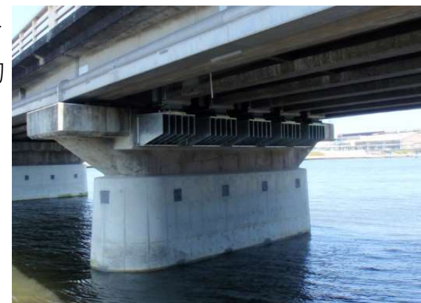
国道 250号 汐見橋 落橋防止装置・橋脚補強 (姫路市)