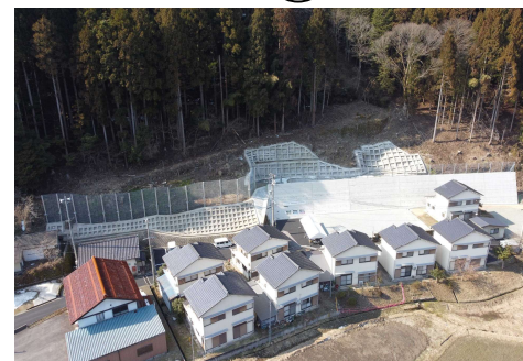
和田地区 急傾斜地対策（香美町）