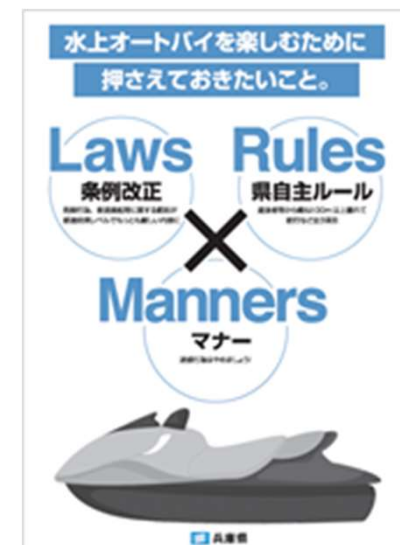
水上オートバイ安全対策リーフレット