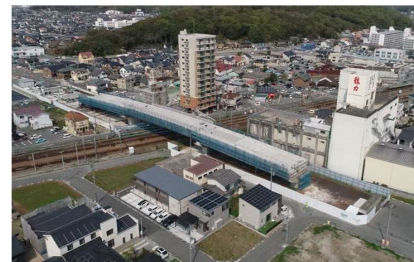
県道 太子御津線 茶ノ木踏切 (姫路市、太子町)