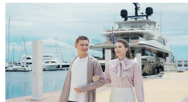
スーパーヨット