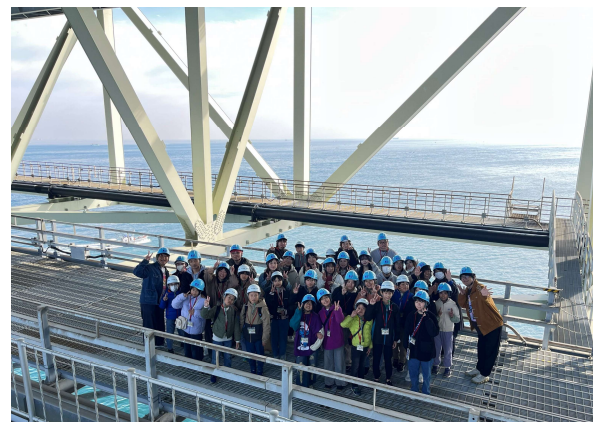
淡路インフラツアー（小学生・保護者）