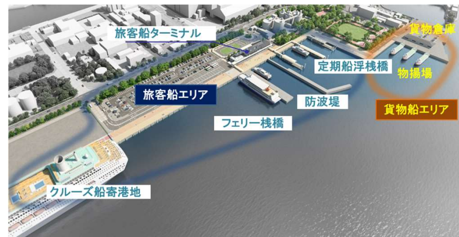
姫路港旅客ターミナルエリアのリニューアル（完成予想図）

姫路港旅客ターミナルエリアにおいて、旅客船利用者の利便性・快適性の向上、にぎわいの創出を図るため、旅客ターミナル建替え等の改修を推進する。