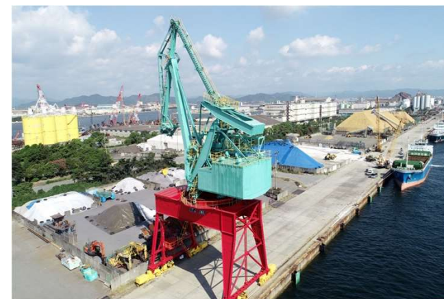
姫路港須加地区 県営クレーン（姫路市）

明石市役所建替え後の本格的な再開発着手までの期間、明石港東外港地区において再開発に向けた機運を醸成するため、明石市と連携して賑わいを創出する。