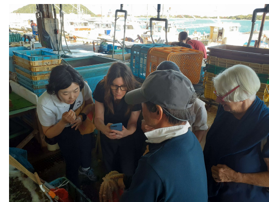
FAMツアーによる地域PR