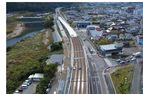
西脇北バイパス（西脇市）