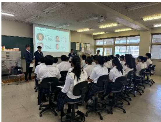
工業高校生等を対象とした建設業魅力説明会