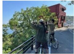
農泊のプログラム (サイクリングツアー)