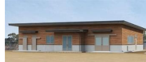
有機農業アカデミー教育棟(イメージ)