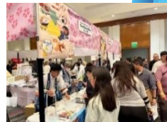
アメリカでの県産品PR