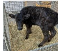
受精卵移植により生まれた但馬牛子牛

(ゲノム情報を用いた但馬牛の改良、優秀な繁殖雌牛の導入や牛舎・機械等の整備支援、但馬牛受精卵移植の取組推進)