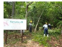
企業の森づくり活動