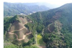
J-クレジットの創出につながる主伐・再造林