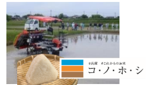
スマート農業の推進、新品種の開発