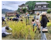
都市住民による 稲の収穫体験