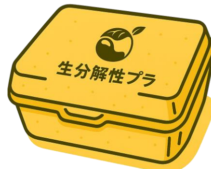
生分解性プラスチック