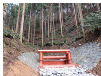
緊急防災林整備（渓流対策）