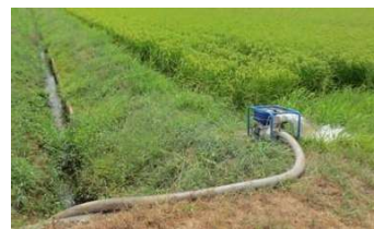
ポンプによる水の反復利用

※国庫補助事業対象は8月1日以降着手分となるため、8月1日より前に着手した取組は、県単独制度により支援