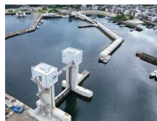
沼島漁港 水門（南あわじ市）