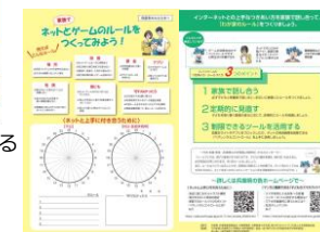
【親子でスマホの使い方を考えるワークシート】