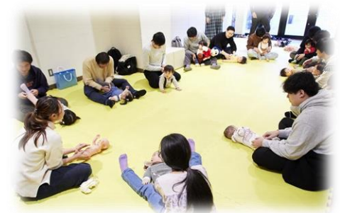
【パパ向け子育てイベント】

家事負担の軽減に向けた「ゆる家事」や家事をシェアする「とも家事」、育休取得経験のある先輩パパの体験談やメッセージ等をホームページで発信