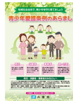
【青少年愛護条例のあらまし】

青少年の保護・非行防止を図るため、青少年補導センターや補導委員への研修会等の開催を通じて、市町による補導活動を支援