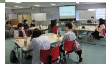
【女性のための働き方セミナー】