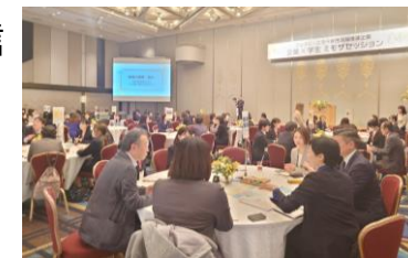
【企業×学生ミモザセッション】