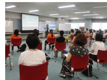
【中小企業等の階層別女性社員研修】