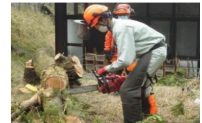
【山の学校での林業体験】