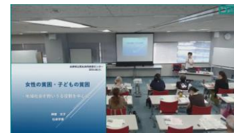
【男女共同参画アドバイザー養成塾】