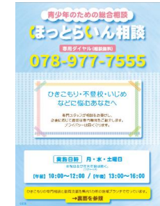
【ほっとらいん相談チラシ】