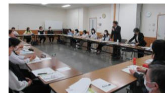
【推進員委嘱式(北播磨)】