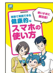
【スマホ等の利用に関するガイドライン】

「親子でスマホの使い方を考えるワークシート」を、県内の小学校1年生等に配布(65,000部)等