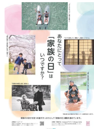
【家族の日啓発ポスター】