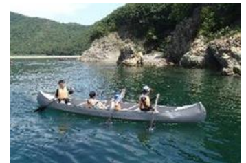
【県立いえしま自然体験センター】