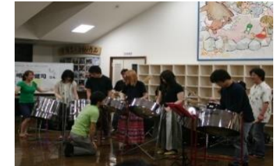
【神出学園での音楽体験】