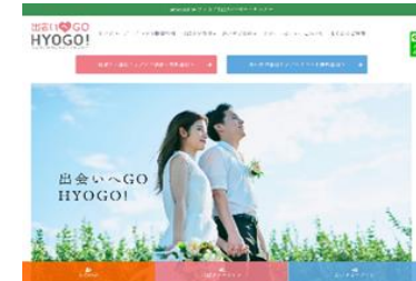
【ひょうご出会いサポートセンターHP】