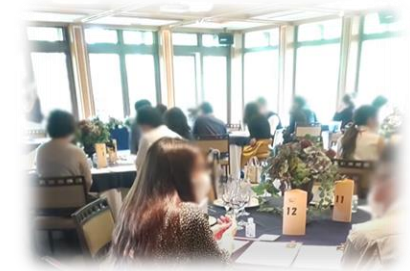
【出会いイベントの様子】