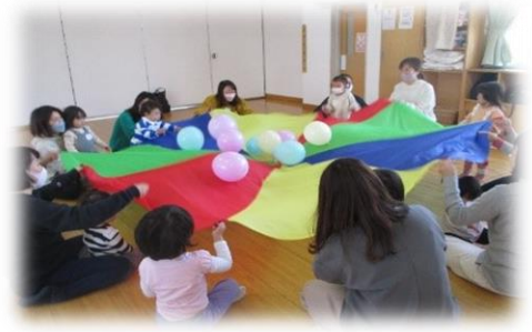
【まちの子育てひろば】

子育て支援団体との連携により、各地域で「子育て家庭応援推進員」を委嘱し、登下校時の見守りや声かけ、虐待・育児不安等のサインをキャッチして関係機関につなぐ活動等を実施、推進員を対象とした研修を県民局・センター単位で開催 ＜R6.3末委嘱者数＞ 1,549名