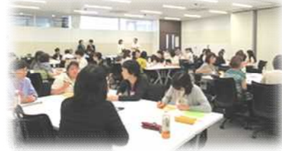
女子大生向けキャリアデザインセミナー