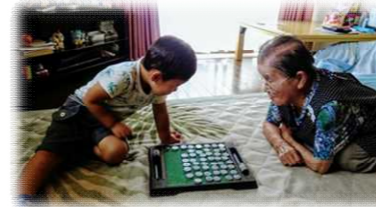
兵庫県知事賞 「対戦中 ひ孫とオセロ おばあちゃん」