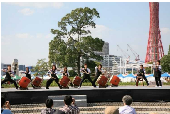
ポートタワーを背景に和太鼓演奏