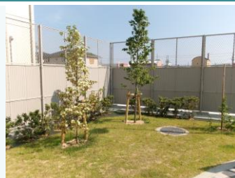
公園の緑化(姫路市)