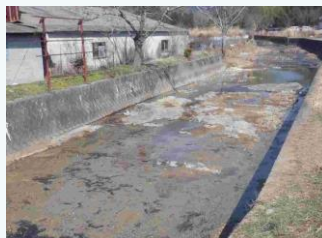
上比延谷川の土砂撤去(西脇市)