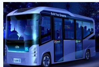
電気バスの導入 (南あわじ市)