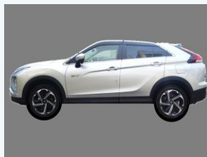
プラグインハイブリッド車の導入 (三木市)