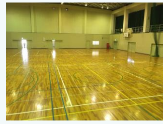
東条第一体育館の空調導入 (加東市)