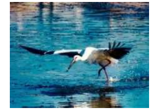
コウノトリが生育できる環境づくり