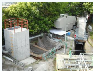
又兵衛抽水場の整備(尼崎市)