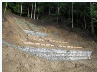
春来地区の治山事業(新温泉町)