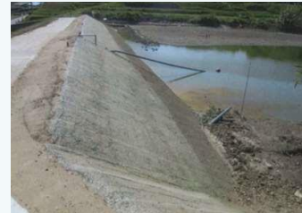
ため池(新池等)の改修(淡路市)