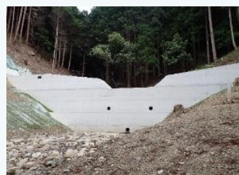
治山ダムの整備(兵庫県)