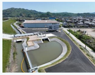
福田排水機場の整備(豊岡市)