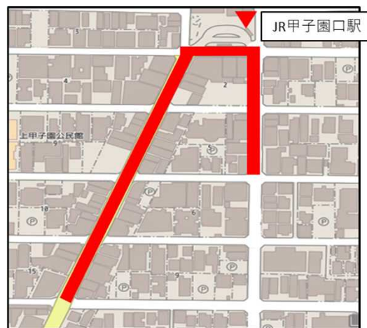
J R 甲子園口駅南側地域