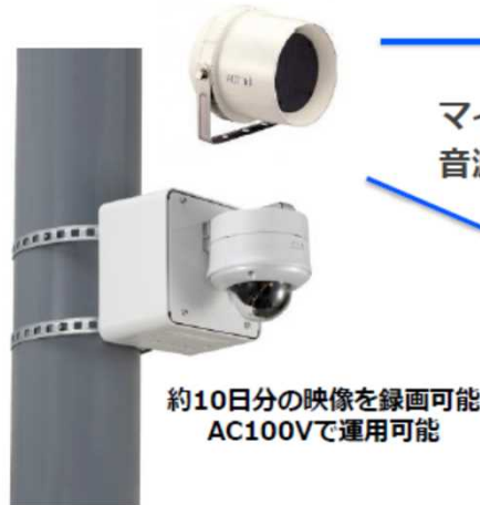
約10日分の映像を録画可能 AC100Vで運用可能