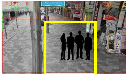
サンキタ通り商店街