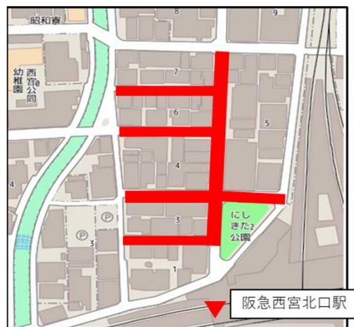
阪急西宮北口駅北西地域