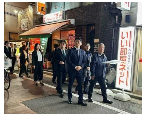
4/11視察の様子（阪急西宮北口駅北西地域）