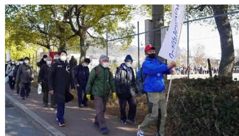
メモリアルウォーク