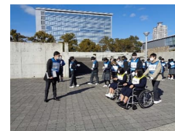
要支援者等避難誘導訓練