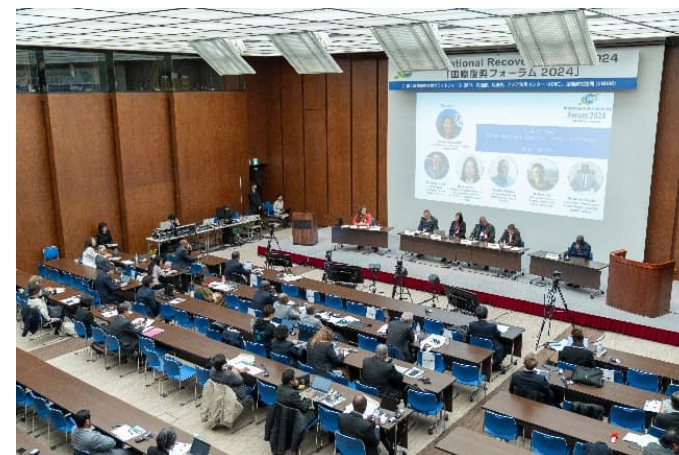
国際復興フォーラム