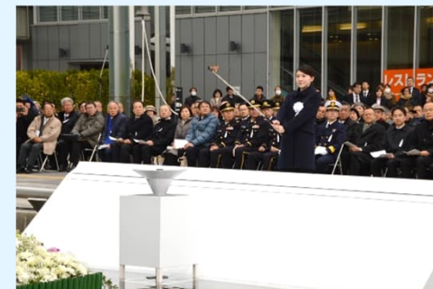
若者による追悼の灯りの献灯