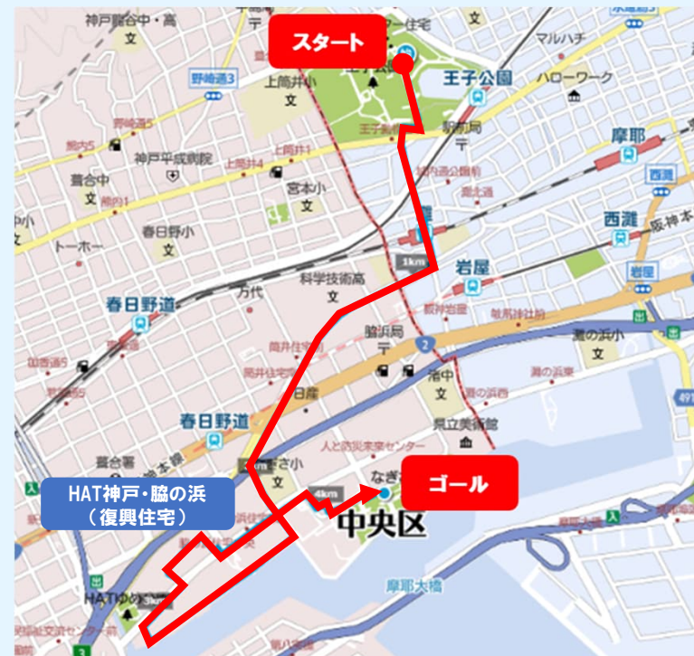
メモリアルウォークコース