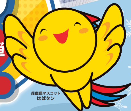
兵庫県マスコット はばタン