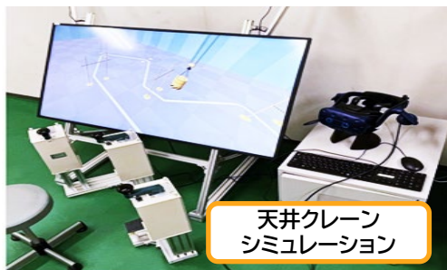
天井クレーン シミュレーション