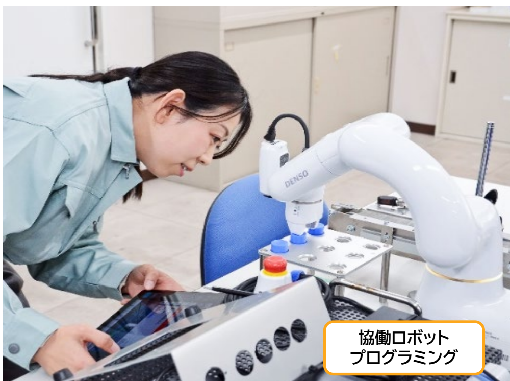
協働ロボット プログラミング