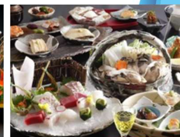
浜会席・牡蠣 (イメージ)