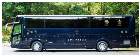
豪華バス「ゆいプリマ」