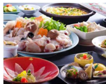
淡路島3年とらふぐづくし (イメージ)

ひょうご五国の宿やイベント、フィールドパビリオンなどを巡る 宿泊付きバスター を販売