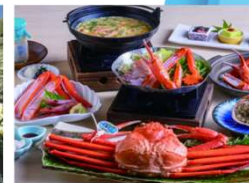
香住ガニフルコース