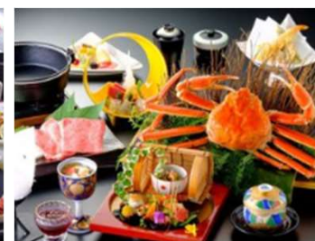
蟹の旬彩膳 (イメージ)