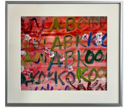
【シルクロードの朝焼け】