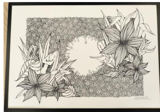
【アイデアとロゴス】