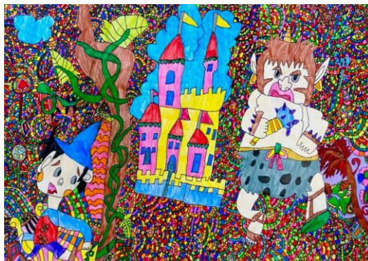
【ジャックと豆の木】