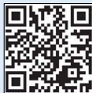
【専用HP二次元コード】