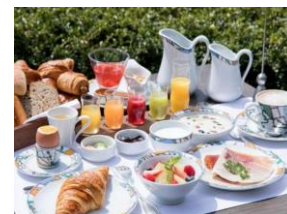
世界の朝食(神戸北野ホテル)

神戸北野ホテル (神戸市) 世界の朝食 ホテルピエナ神戸 (神戸市) 朝食ビュッフェ 欽山 (神戸市) 旬の「国産天然鱧」懐石料理 上山旅館 (姫路市) 源泉を使用した「湯壺がゆ」