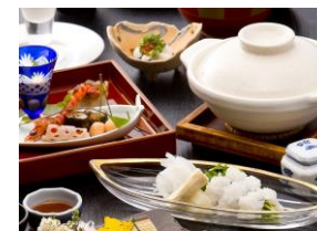
国産天然鱧懐石(欽山)