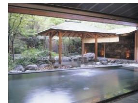
西村屋ホテル招月庭