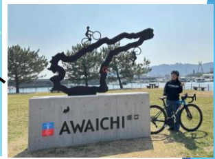
給水スポット 炬口漁港公園