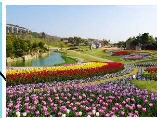
スタート・ゴール 国営明石海峡公園