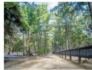
エイドステーション② 慶野松原