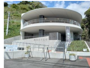
エイドステーション① 灘黒岩水仙郷