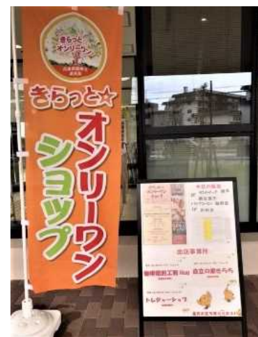
宝塚健康福祉事務所にてショップ開設