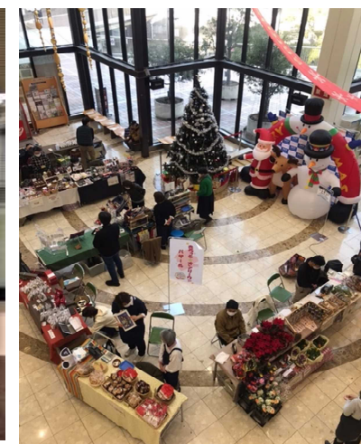
“きらっと☆オンリーワン”バザール 宝塚 クリスマスのにぎわい