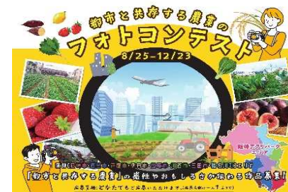
阪神都市農業フォトコンテストの開催