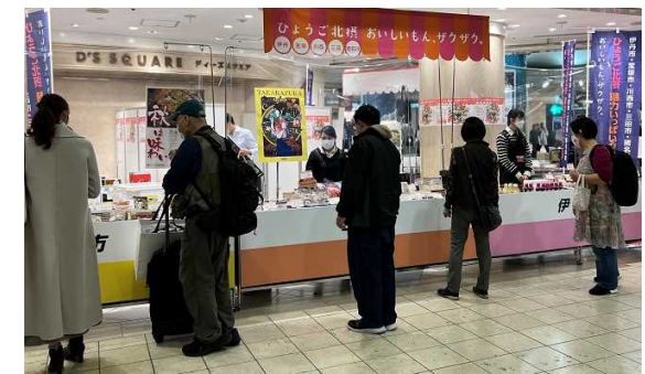
ディアモール大阪で開催した「ひょうご北摂魅力いっぱいフェア」

大阪駅周辺のイベントスペースを活用し、地域の観光情報の発信や地域特産品を販売する物産展を開催する。