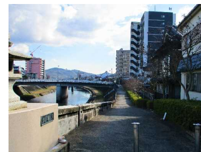
市道相生橋浄水線と武庫川(現況)

三田市と連携し、市街地再開発事業により整備されてきた三田駅周辺の「 新しいまち 」と三田城跡や旧九鬼家住宅資料館などの「 歴史の面影あふれるまち 」をつなぎ、 潤いのある散策空間を創出し、賑わいを演出 するための市の取り組みと合わせて武庫川護岸の一部区間をリニューアルし、案内パネルを設置する。