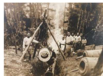
造成時の施工の様子

古くから残る母子大池疏水(昭和8年完成)を将来にわたり適切に維持管理するとともに、地域の貴重な資源として地域全体で守り活用していく取組み(保全計画・啓発資料の作成、イベント実施等)を支援する。