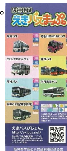
阪神都市圏公共交通利用促進会議発行のマップ

阪神地域で整備した10駅におけるバス利用者の利便性をより高めるシステムの普及促進に取り組むとともに、耐用年数を超えた機器等の更新を行う。