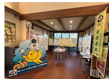
食と農を通じた災害時の備え展