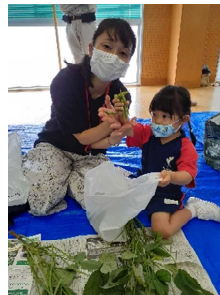
親子でのさやもぎ体験