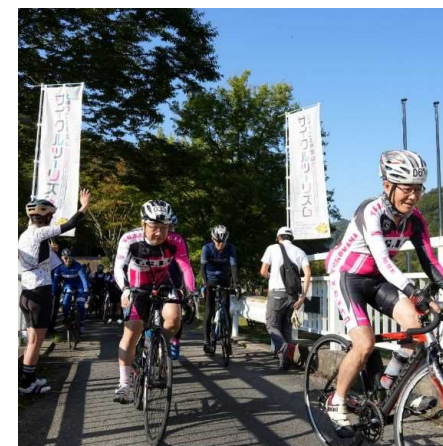
ひょうご北摂里山ライド2022スタート地点

サイクルコースの魅力を紹介する動画を作成し、ココシル「ひょうご北摂ライフ」ポータルサイトやFacebook、Instagram等で発信する。