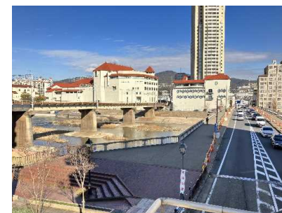
宝塚大橋(歴史パネル設置検討箇所)

宝塚市と連携し、武庫川(宝来橋～宝塚大橋)周辺において、賑わいを創出するため、宝塚市が実施する「花のみち」再整備に合わせ、観光地等を楽しく歩いて周遊するために歩道に歴史パネルを設置するなど、 歩行者を重視した歩道空間を整備 する。