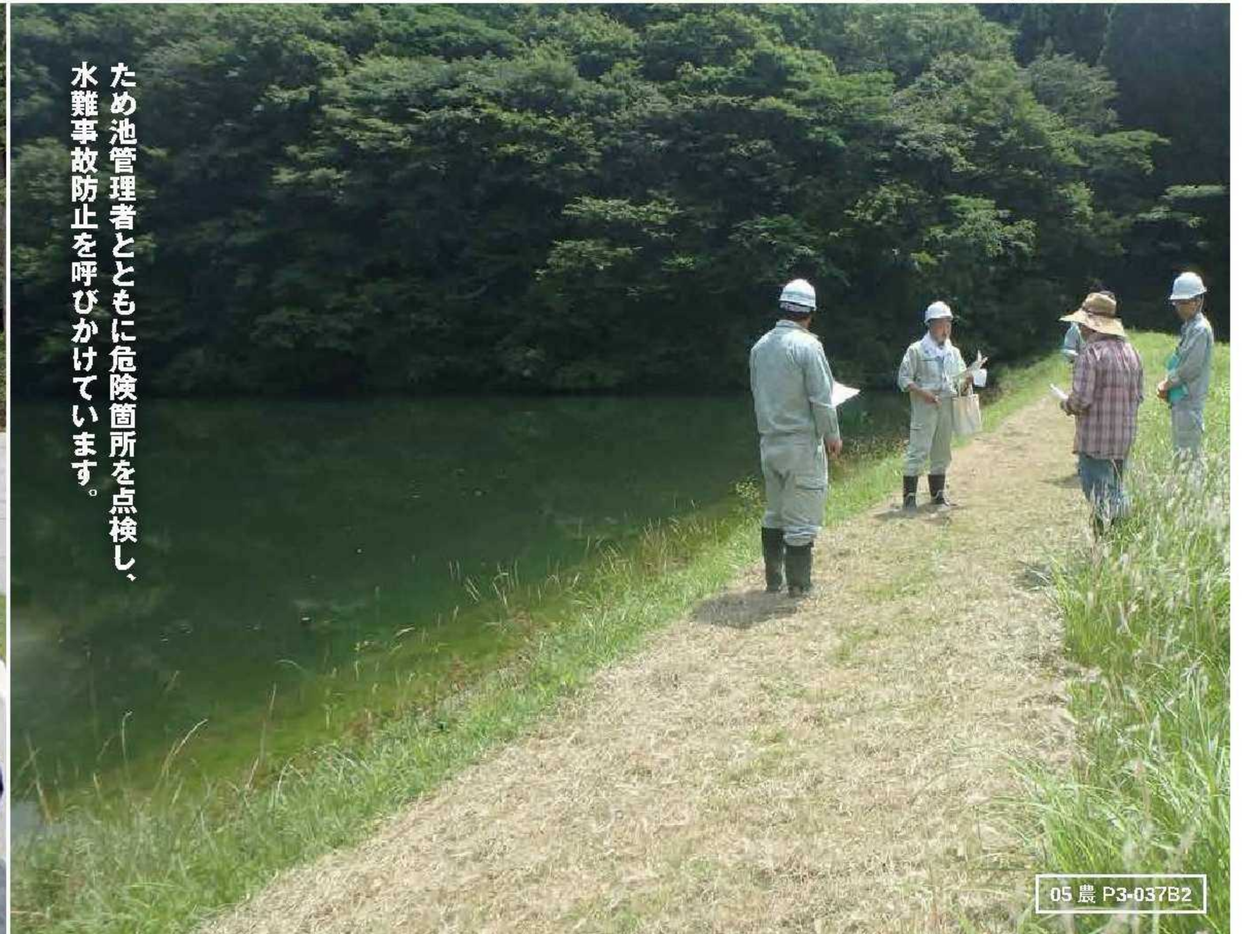
ため池管理者とともに危険箇所を点検し、水難事故防止を呼びかけています。