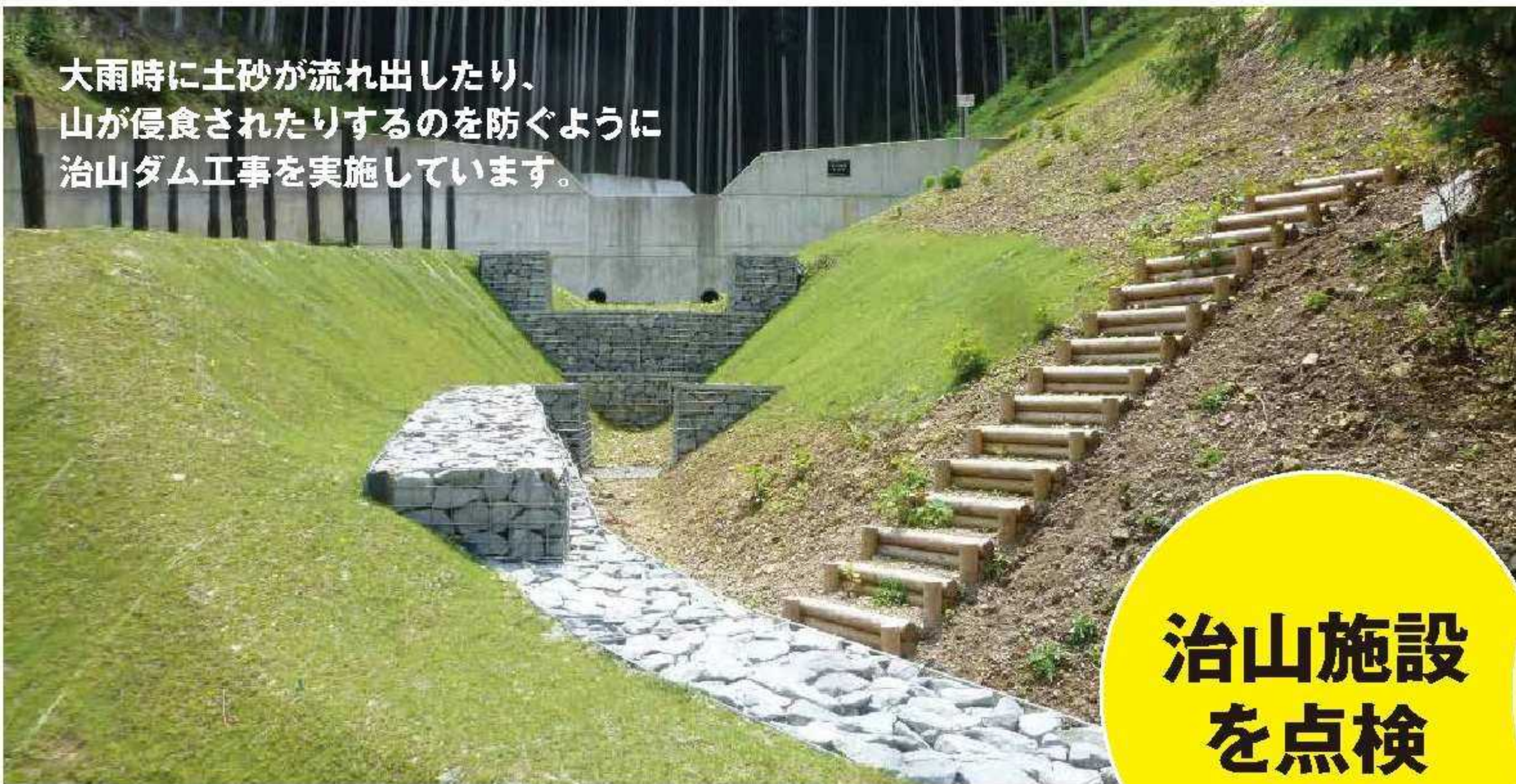
大雨時に土砂が流れ出したり、山が侵食されたりするのを防ぐように治山ダム工事を実施しています。