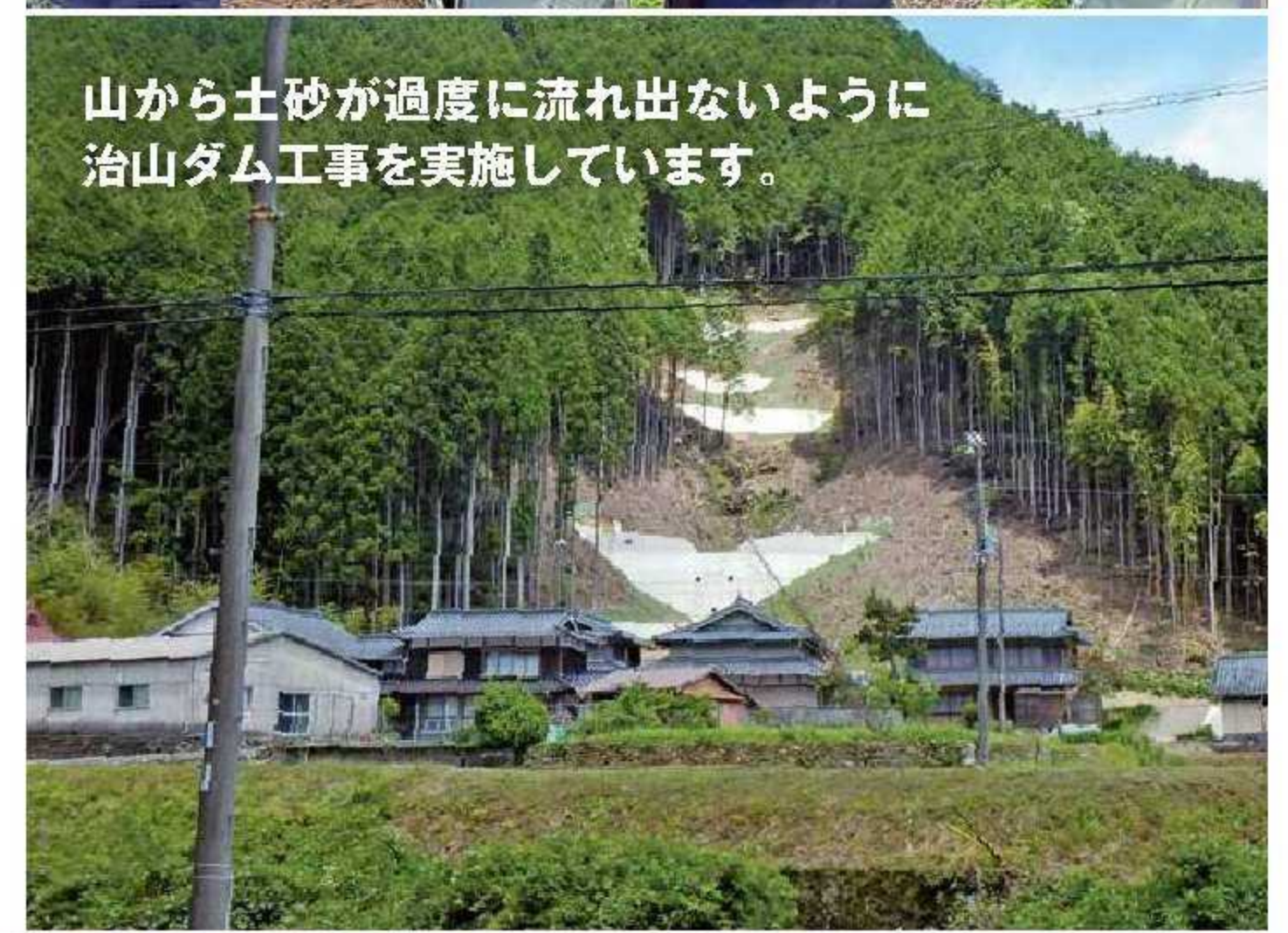
山から土砂が過度に流れ出ないように治山ダム工事を実施しています。