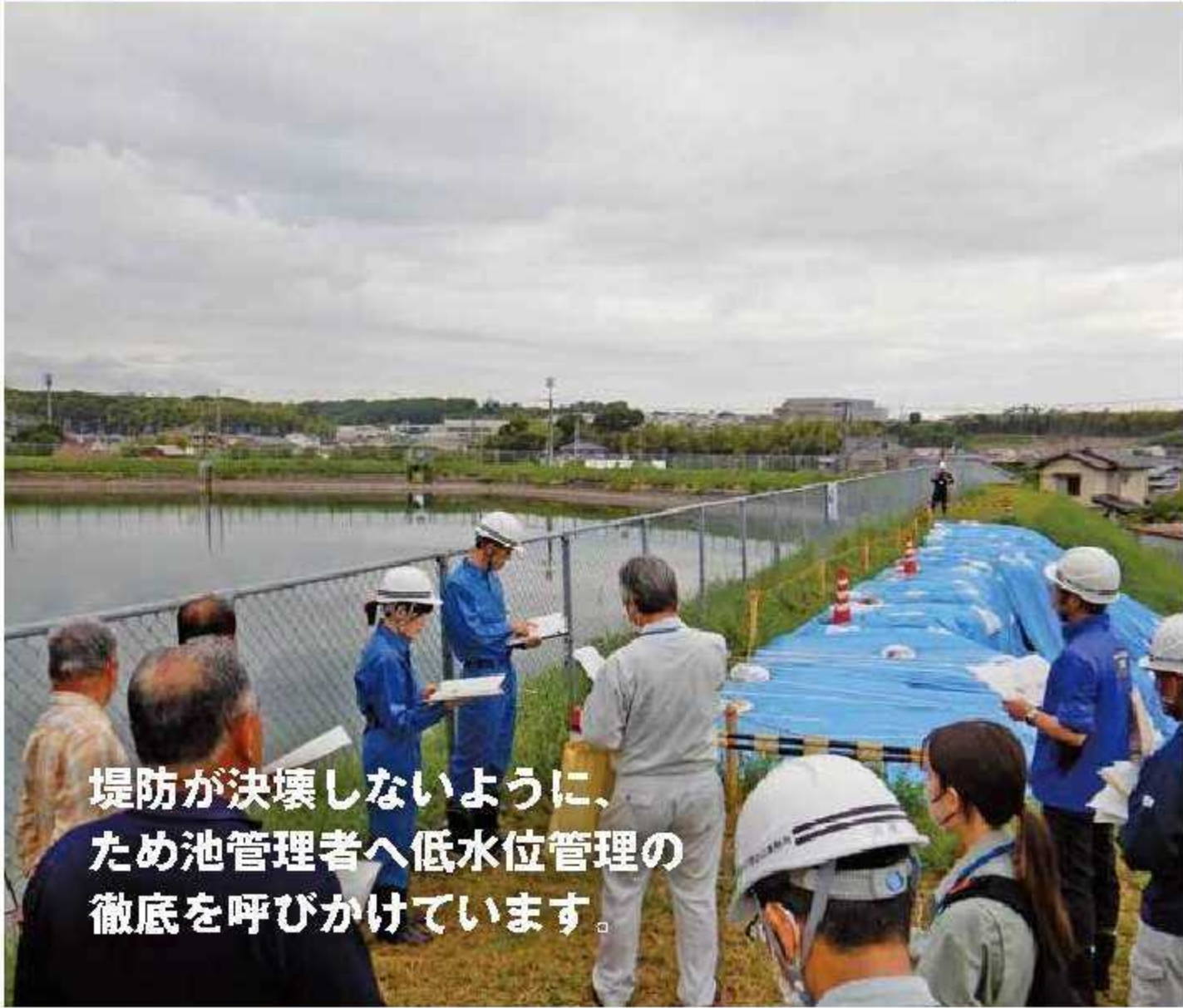
堤防が決壊しないように、ため池管理者へ低水位管理の徹底を呼びかけています。