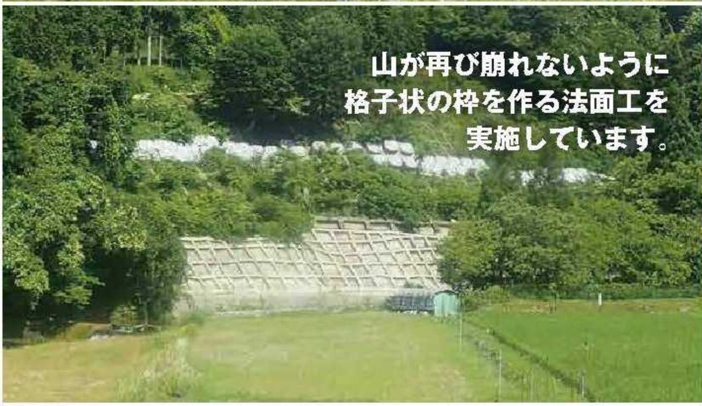
山が再び崩れないように格子状の枠を作る法面工を実施しています。