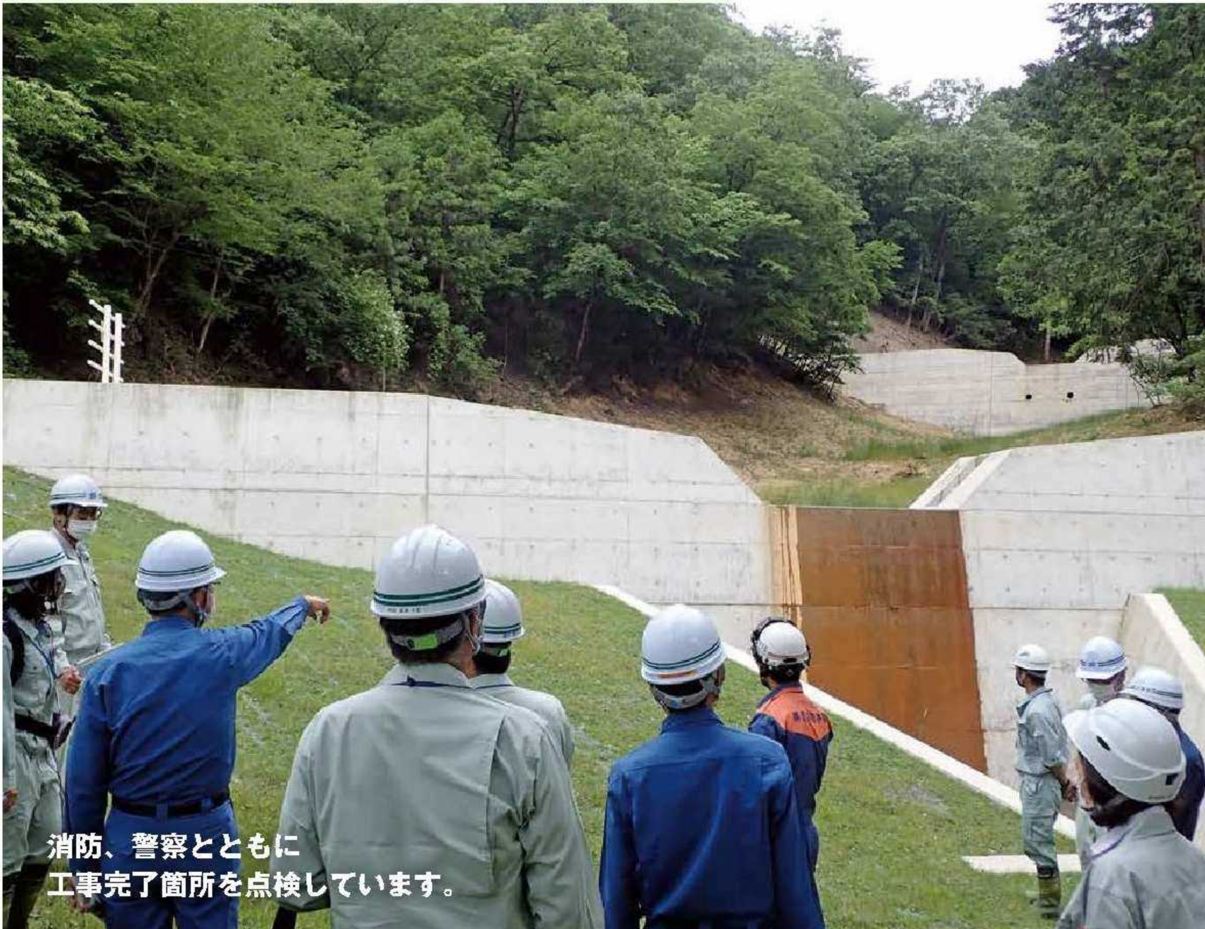
消防、警察とともに工事完了箇所を点検しています。