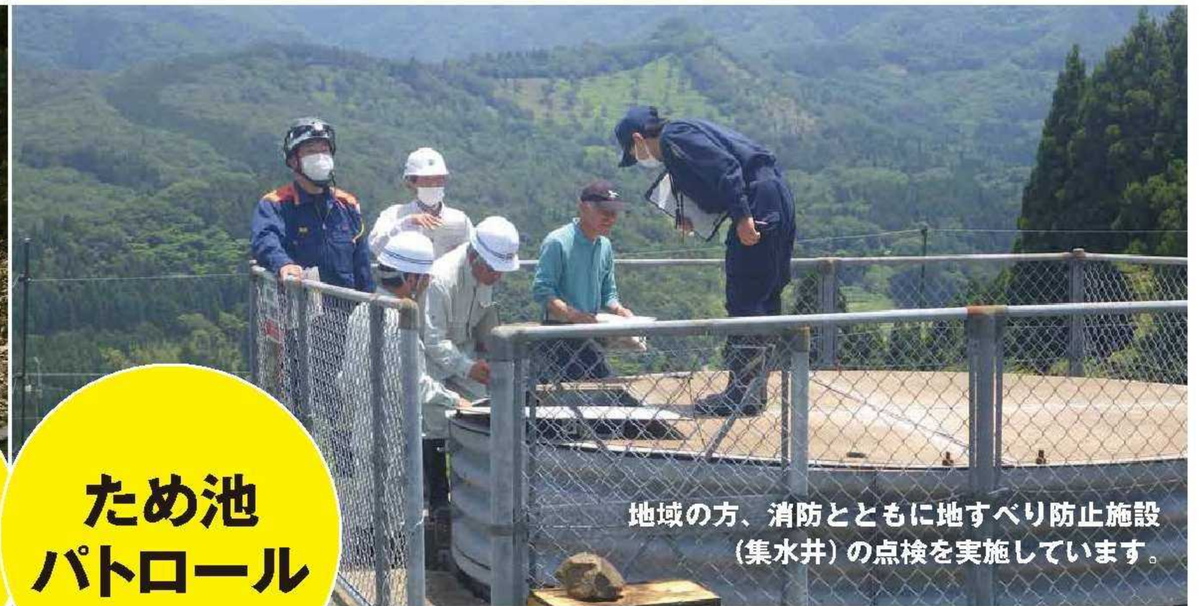
地域の方、消防とともに地すべり防止施設(集水井)の点検を実施しています。