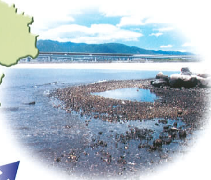
南芦屋浜人工海浜(芦屋市)