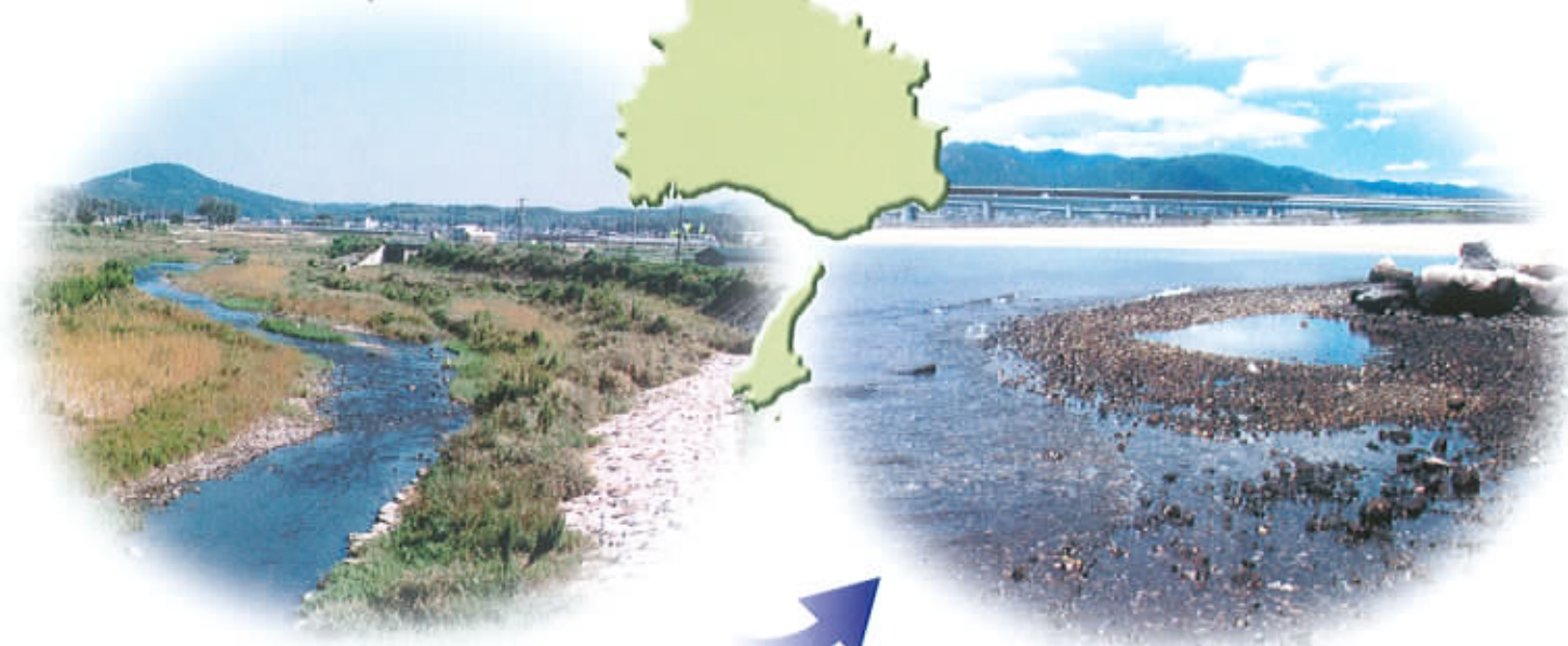
明石川(神戸市西区)