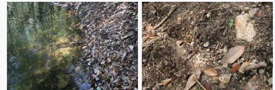
写真、汀線付近の侵食状況