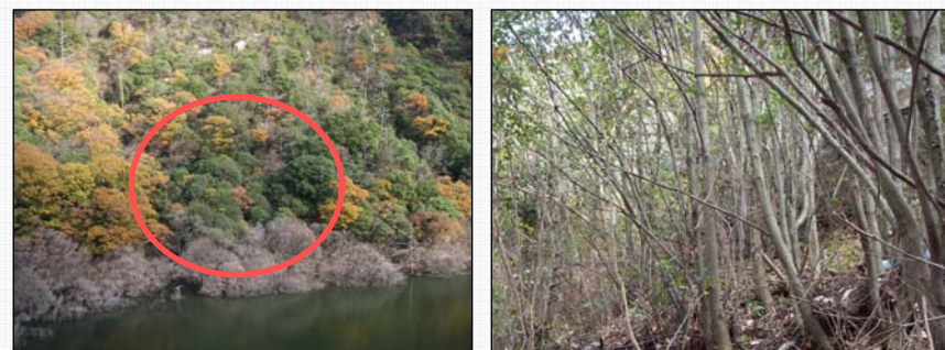
写真、表層土壌の流出調査地点（左：概観、右：林内の様子）

試験湛水の実施前後に同一箇所において、表層土壌（A 0 層）の厚さを測定した（写真上）。また、地表面の变化を観察した（写真下）。