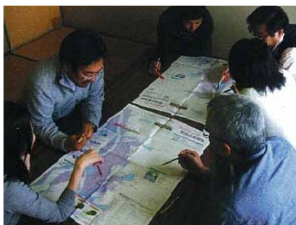
写真 4. 1. 5 住民主体のハザードマップづくり