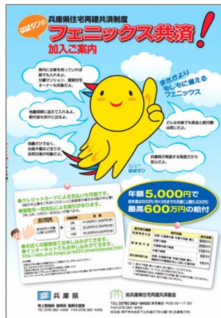
写真 4. 1. 6 水害からの復旧の備え (兵庫県住宅再建共済制度)