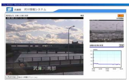
写真 4. 1. 4 河川監視カメラ画像の配信