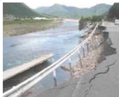
平成23年台風12号による被害 (加古川水系杉原川;多可町)