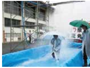
太子町ゲリラ豪雨体験