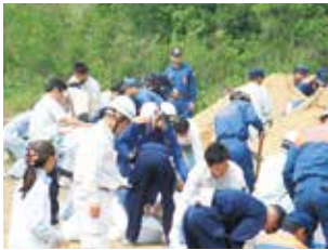
水防技術講習会土のう作成