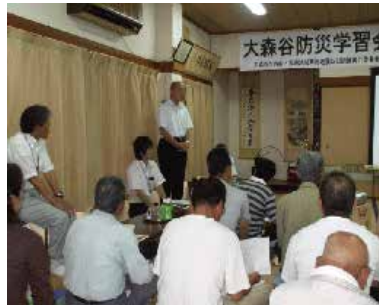
防災に関する講演会