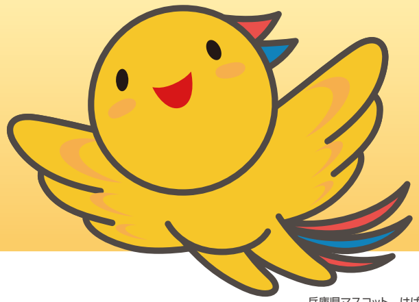
兵庫県マスコット はばたん