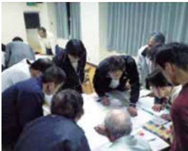
地域防災マップ作成ワークショップ