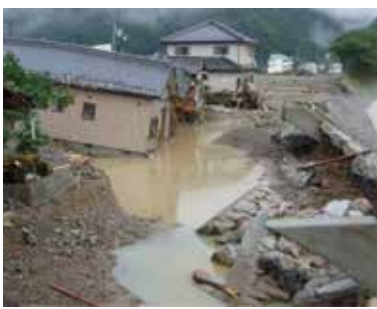
平成21年台風9号による被害 (千種川水系佐用川;佐用町)