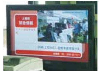
土砂災害情報伝達演習