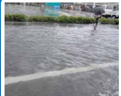
大雨で道路が水浸しになっている様子 (神戸市内)