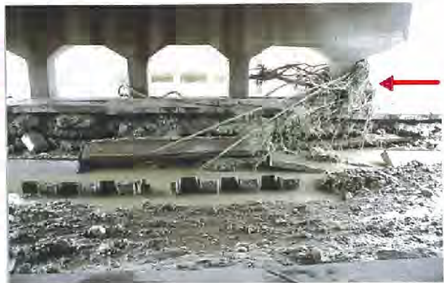
左岸 阪神電鉄武庫川駅架橋下 高水敷