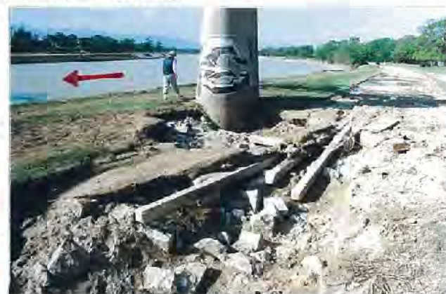
高水敷の都市ガス管橋梁部