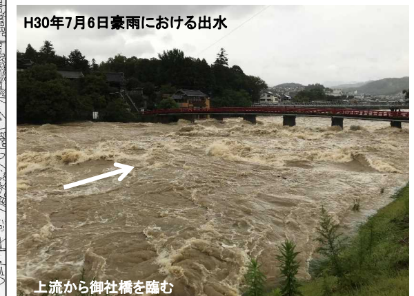
H30年7月6日豪雨における出水