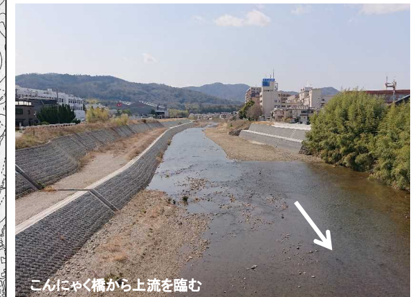
こんにやく橋から上流を臨む