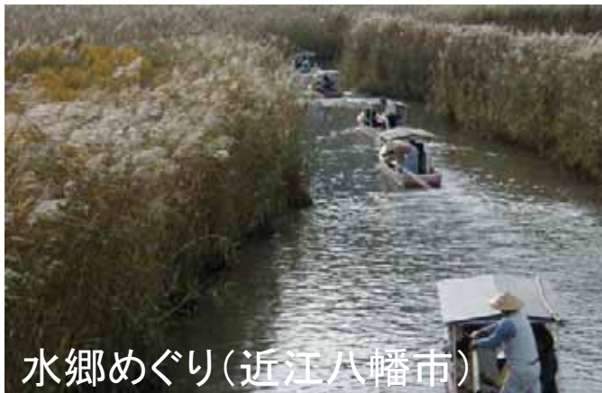
水郷めぐり(近江八幡市)