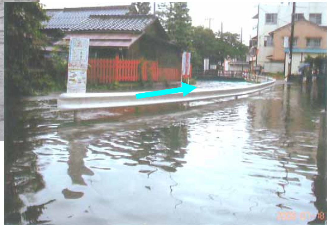
米川(長浜市神前町)