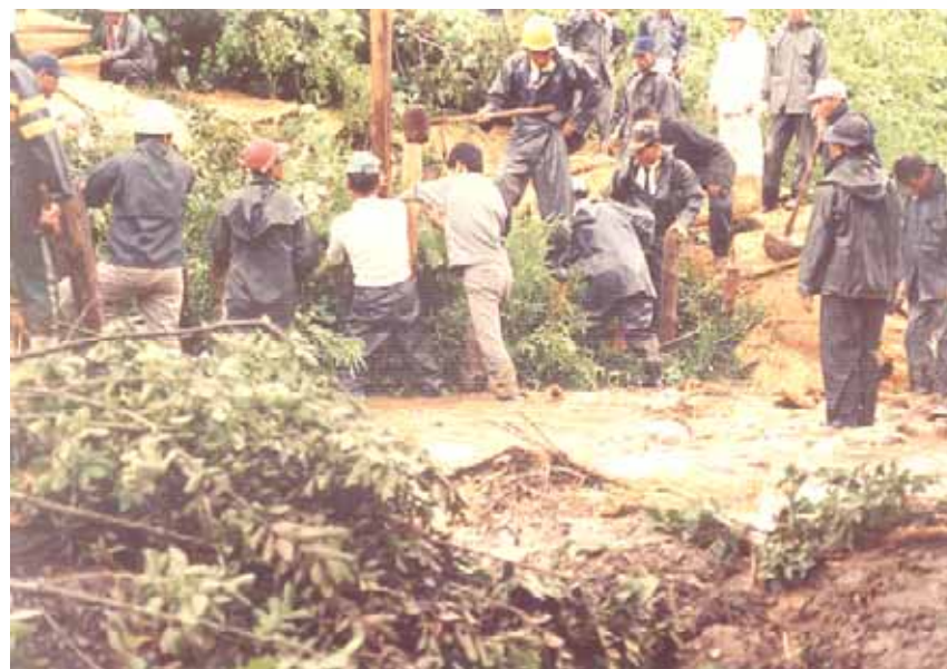
高時川での水防活動