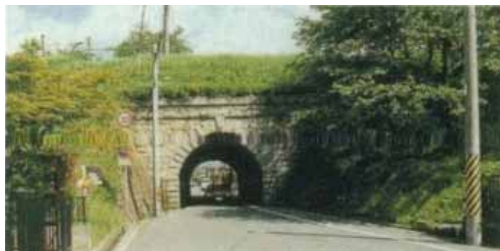
野洲川支川_由良谷川隧道 (湖南市)