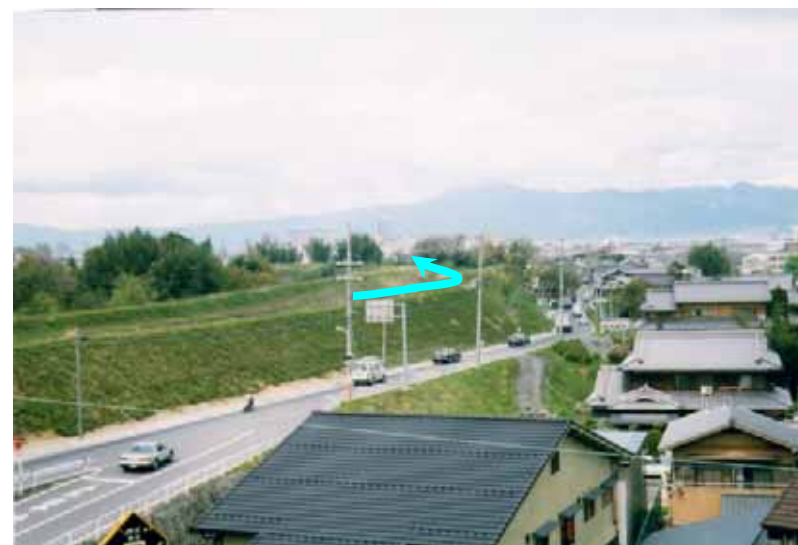
草津川支川_金勝川(栗東市)