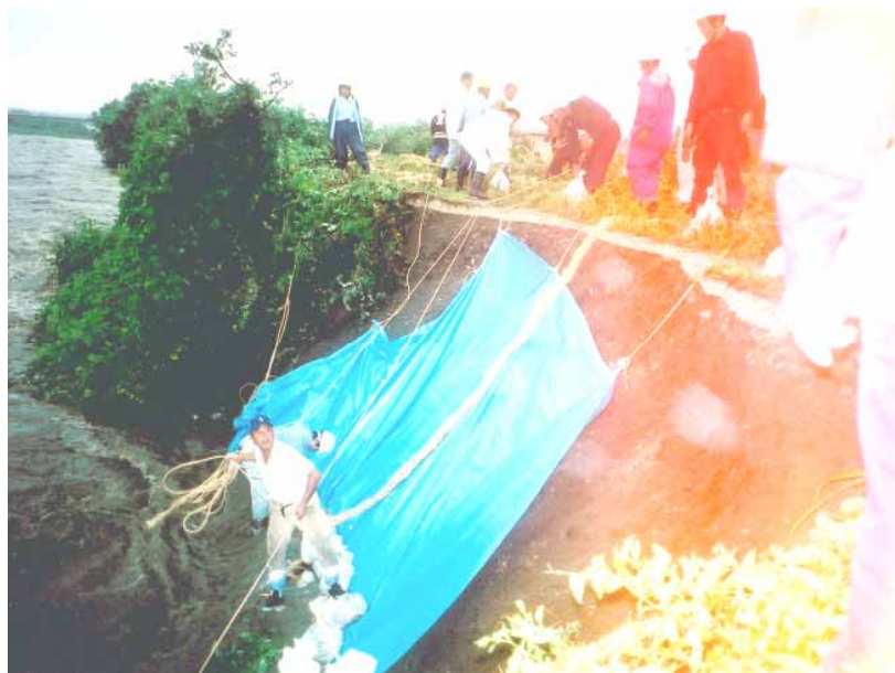
姉川での水防活動 (旧浅井町相撲庭)