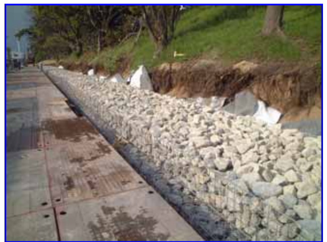
写真1 堤防裏法尻のドレーン工