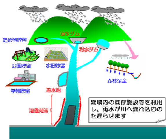
図 2 これからの治水対策