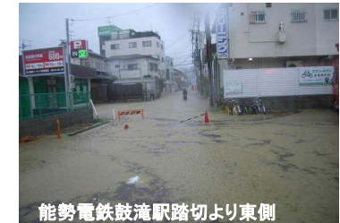
能勢電鉄鼓滝駅踏切より東側