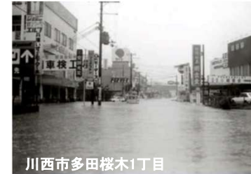
川西市多田桜木1丁目