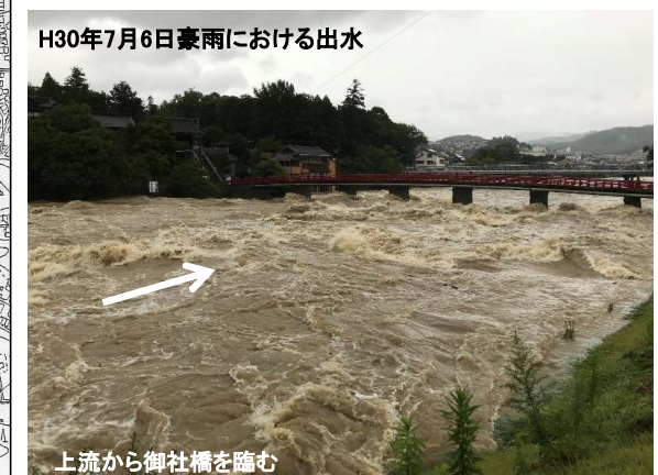
H30年7月6日豪雨における出水