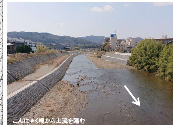
こんにやく橋から上流を臨む