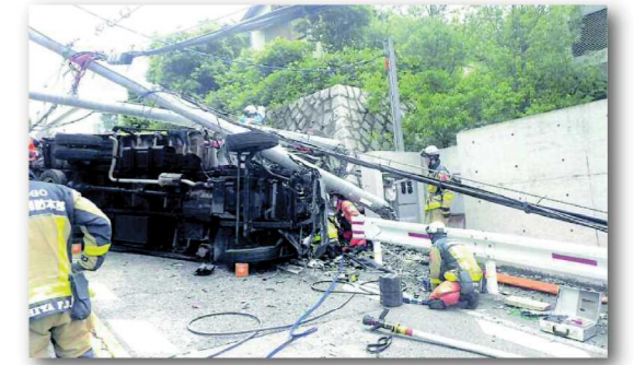
事故の様子 (令和5年6月14日)

<取組み体制の種別> ◆個別取組み：個別に取り組む ◆キャンペーン：実行委員会的に取り組む ◆プロジェクト：目標・方法を具体化し協働して取り組む ◆研究開発：研究会で取り組む