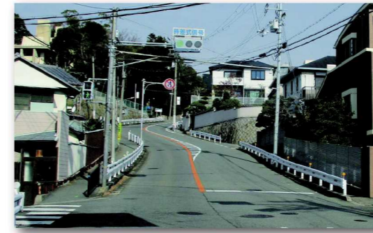
開森橋からライト坂を望む