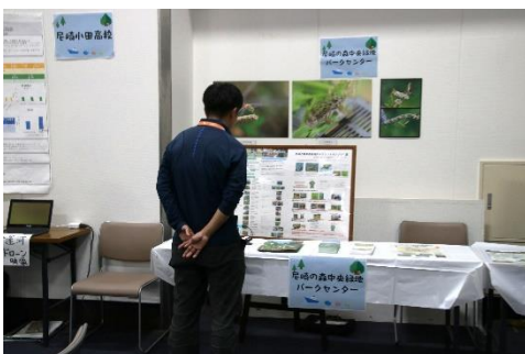
尼崎の森中央緑地パークセンター