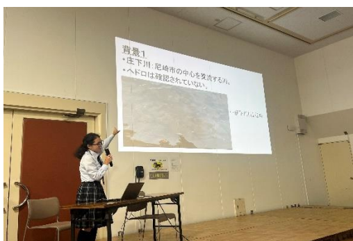
兵庫県立尼崎小田高等学校