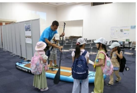
AMAGASAKI CANAL SUP