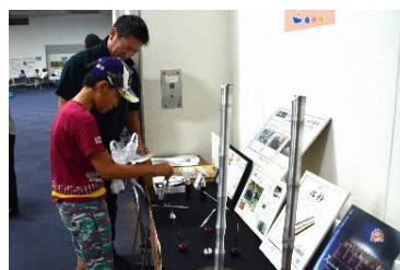
アマテイ&デライトラボ