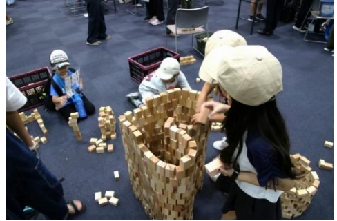
ネイチャークラブ