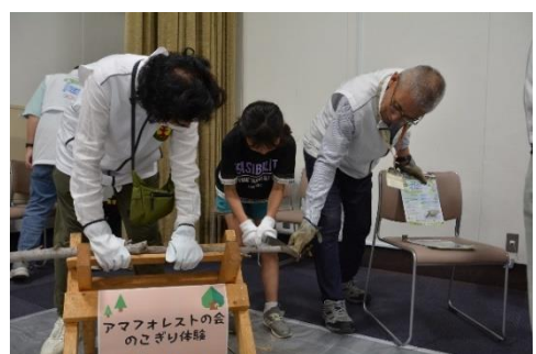
アマフォレストの会