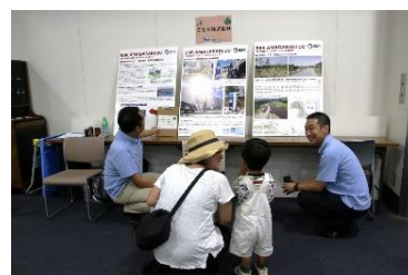
E S R