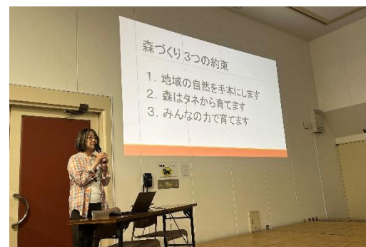
尼崎の森中央緑地パークセンター