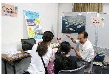
ひょうご環境創造協会