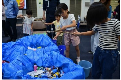
エコフィッシング