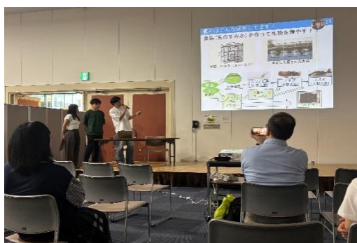
尼崎運河〇〇クラブ・国立大学法人徳島大学