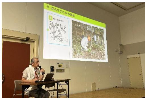
アマフォレストの会