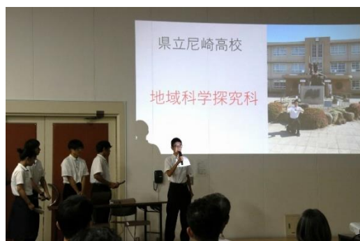
兵庫県立尼崎高等学校