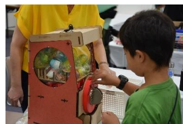
日本山村硝子（循環ガチャ）