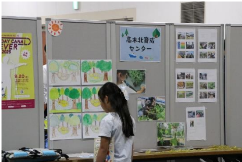
高木北育成センター