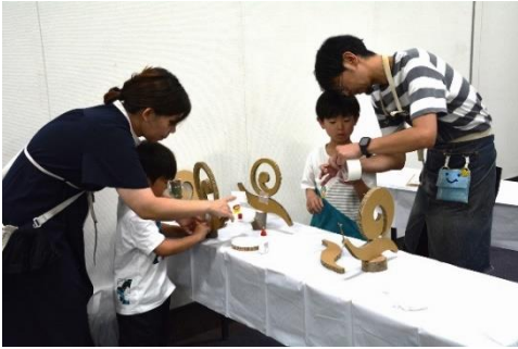
アップサイクルアート