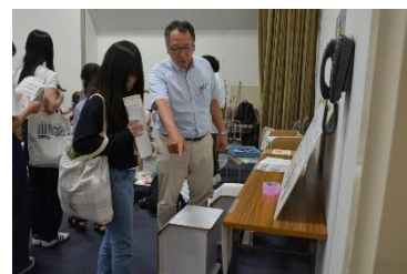
カワグチマック工業