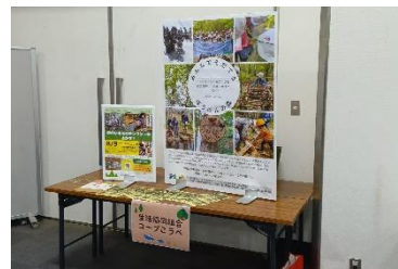
生活協同組合コープこうべ