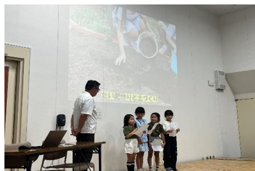
高木北育成センター&ネイチャークラブ