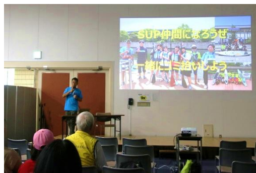
AMAGASAKI CANAL SUP