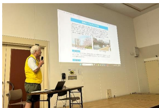
尼崎キャナルガイドの会