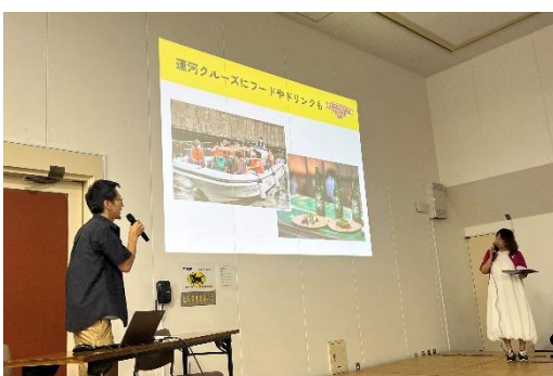
CANAL FRIDAY PARTNERS