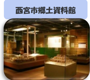
西宮市郷土資料館