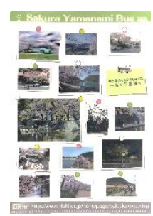
(さくらやまなみバス)