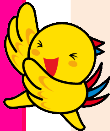
兵庫県マスコット「はばタン」