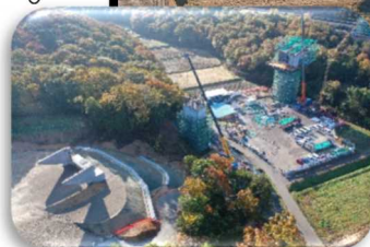
↑ 今回見学の現場 (東播磨南北道路)