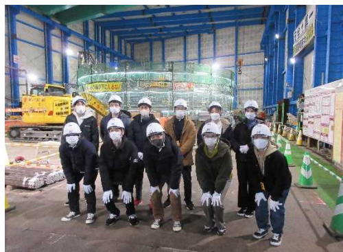
※写真は昨年度実施の見学会の様子