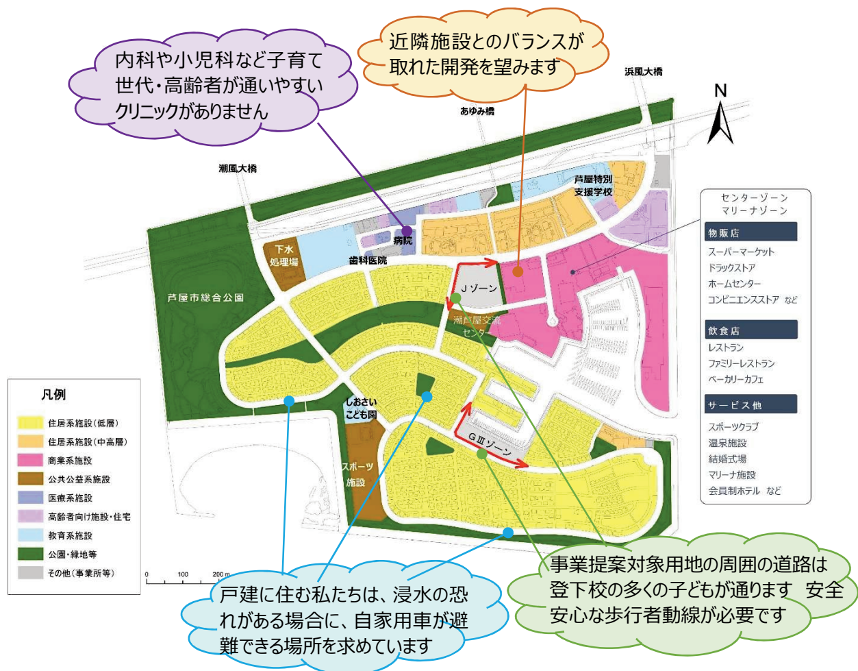
図4 南芦屋浜地区 現況図

未利用地の活用にあたり、事業を展開する事業者の方が以上に示すような地域に望まれる土地活用により地域とともに発展できることを期待しています。