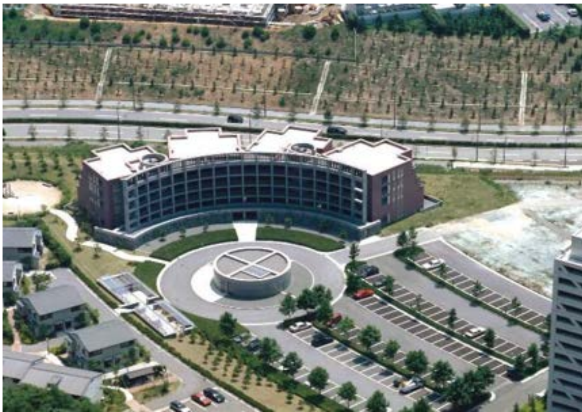
⑨分譲促進施設（中層住宅・オプトヒルズ）