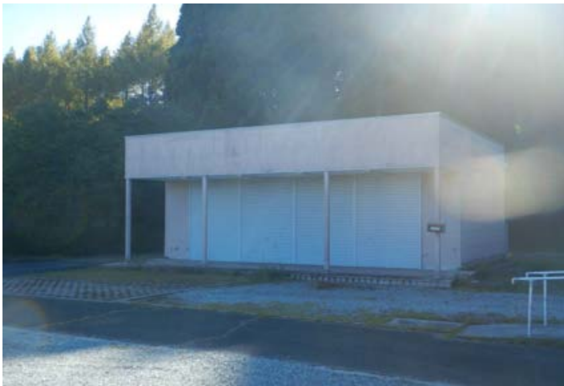
⑦定住・交流促進施設（はりまくらぶ）