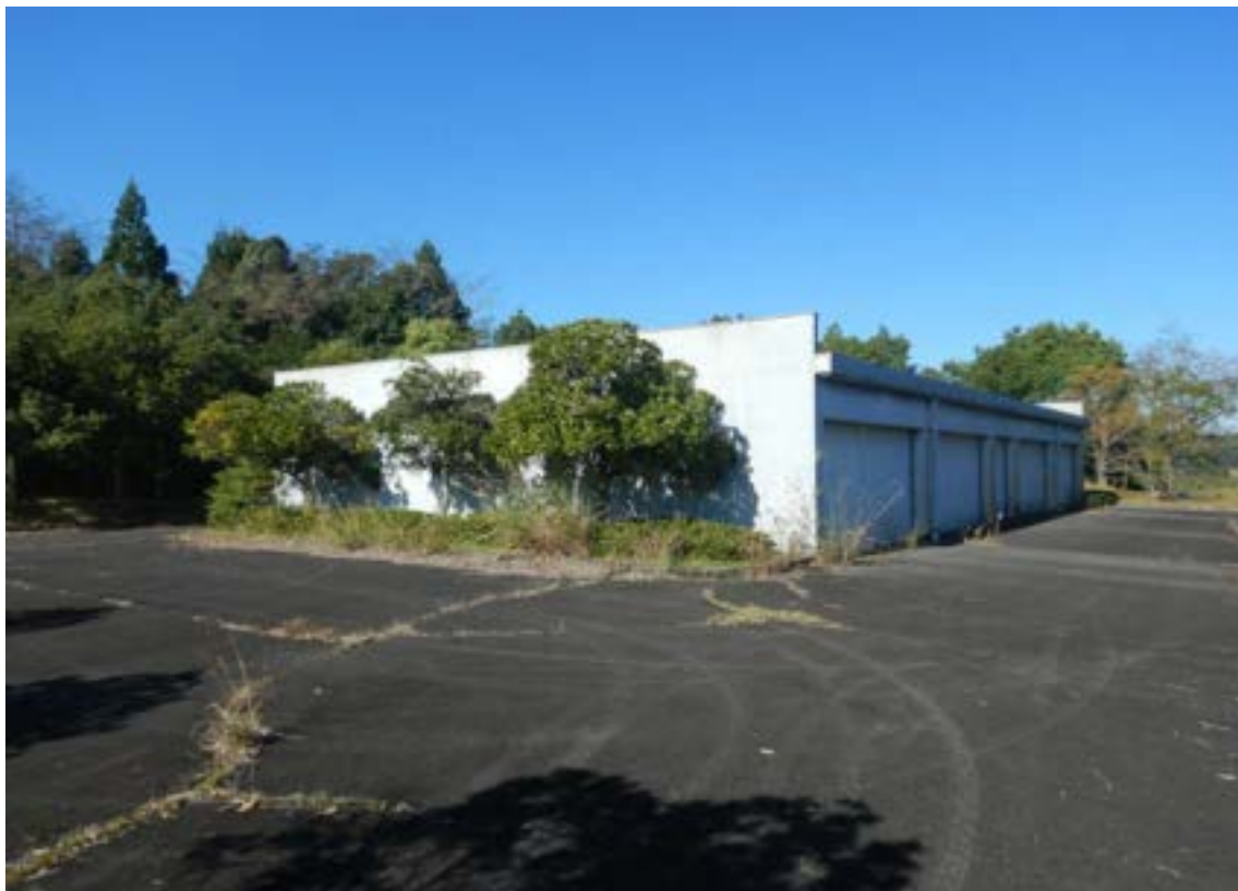
⑤光都サービスセンター