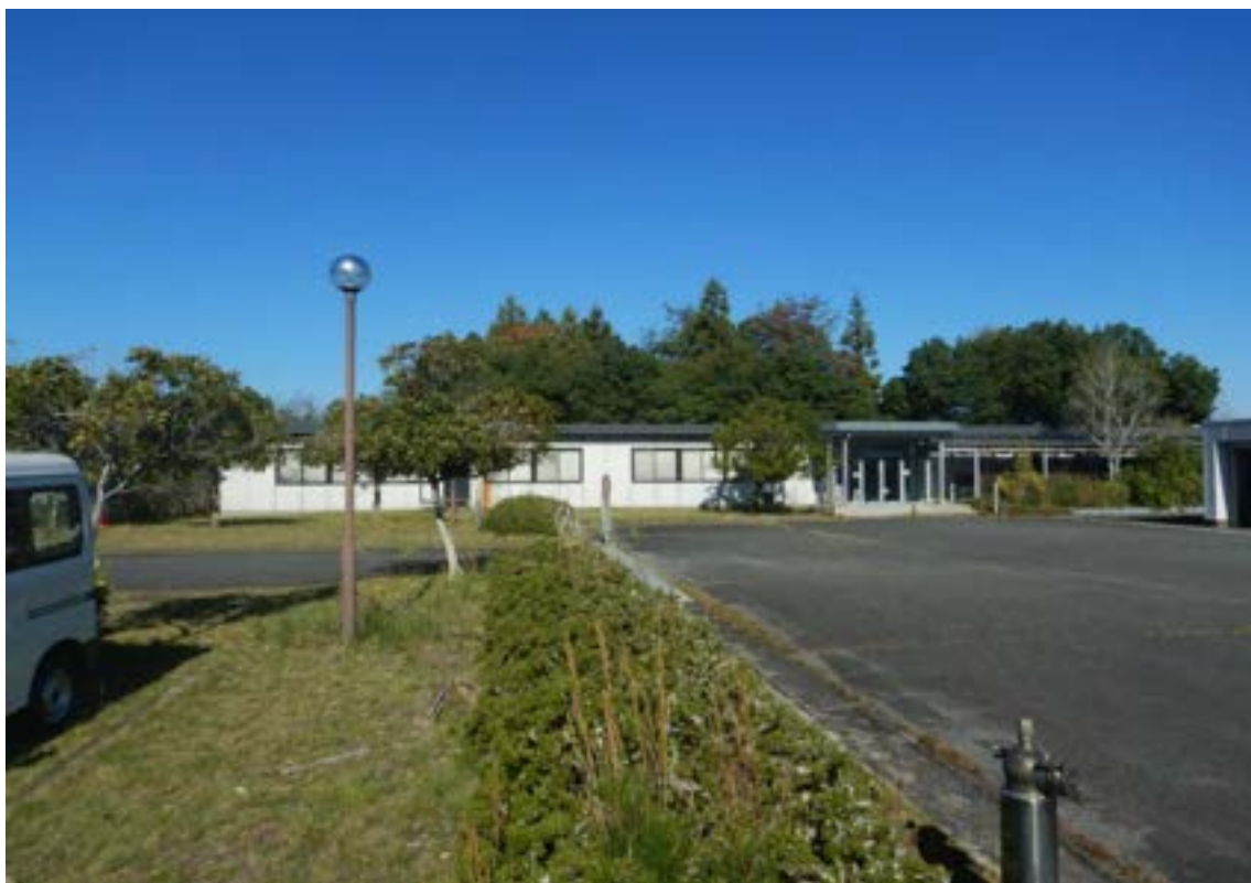
③旧 播磨科学公園都市まちづくり事務所車庫①