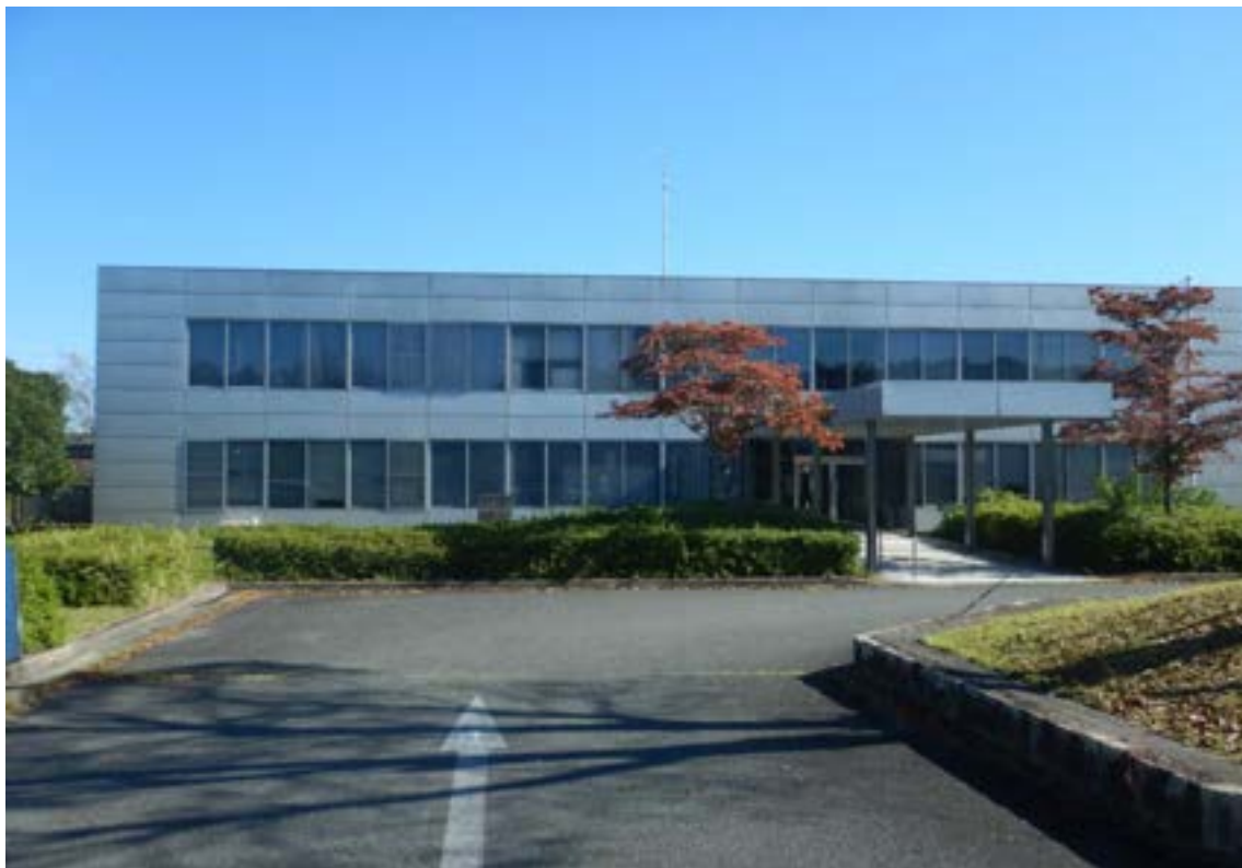
①旧 播磨科学公園都市まちづくり事務所 2号館