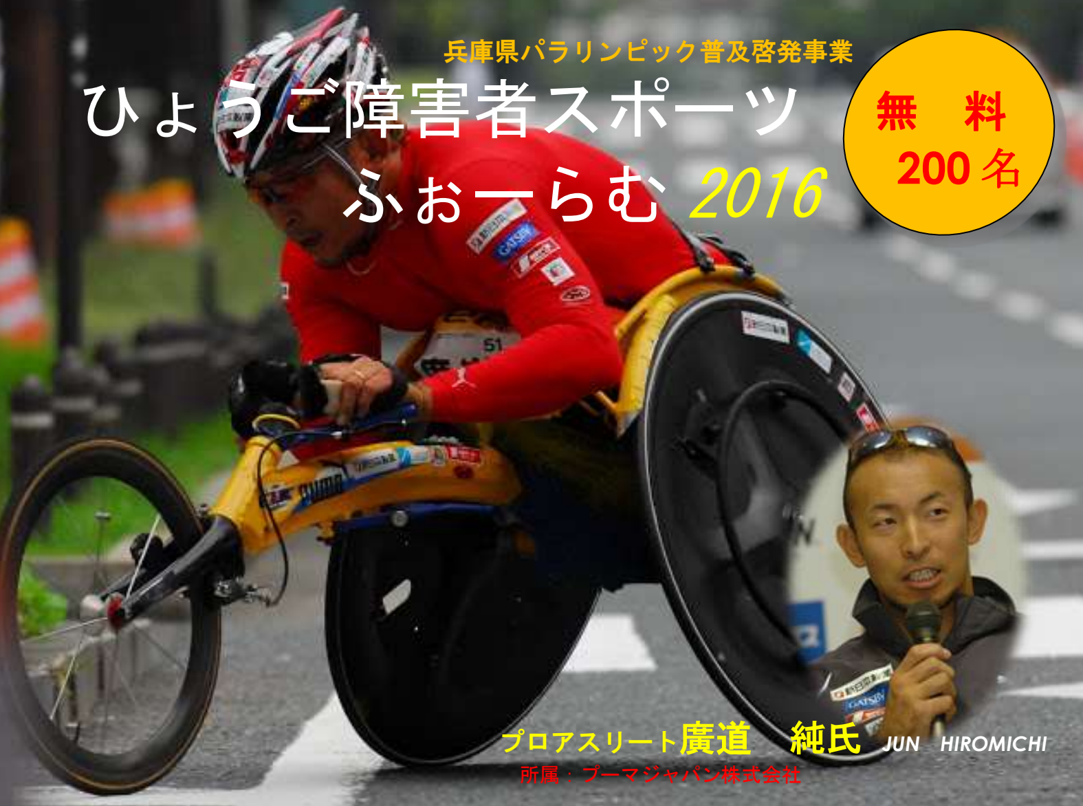
プロアスリート 廣道 純氏 JUN HIROMICHI 所属：プーマジャパン株式会社

1994年ボストンマラソンを皮切りに世界各国のレースに出場。96年大分国際車いすマラソンでは日本人初の総合2位。2000年シドニーパラリンピック800m銀メダル、2004年3月には日本人初のプロ車いすアスリートとして独立。その年に行なわれたアテネパラリンピック800mで銅メダルを獲得。2008年北京パラリンピックでは、大会前までの世界記録を上回る記録で8位入賞。プロのアスリートになってからは、年間25~30回のレースに出場しながら、記録や自身の可能性に積極的にチャレンジ。テレビ、ラジオの出演、講演など全国各地で活躍する現役選手