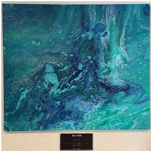
作品名 海水の緑地 作者名 山口千里 (やまぐちちさと) サイズ 450×530mm