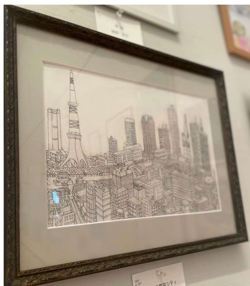
作品名 私の中の東京シティ 作者名 神戸唯史 (かんべただふみ) サイズ 240×340mm