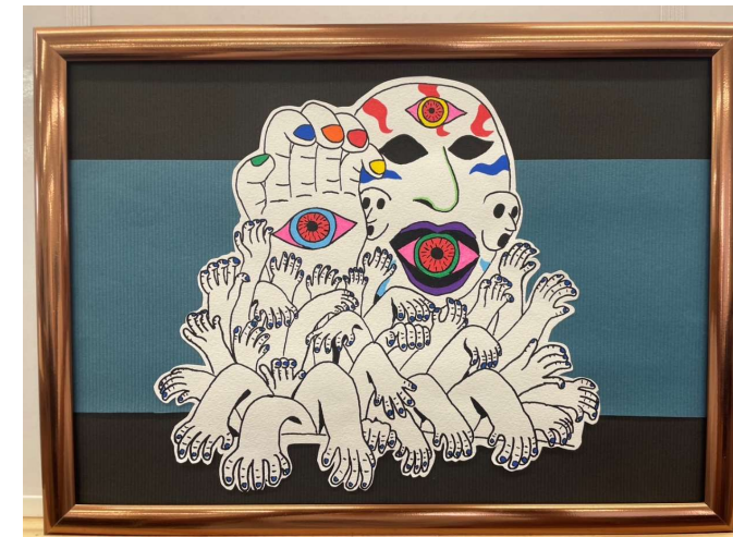
作品名 オモシロ・ホラーアート 作者名 岡崎甲一 (おかもとかういち) サイズ 200×290mm