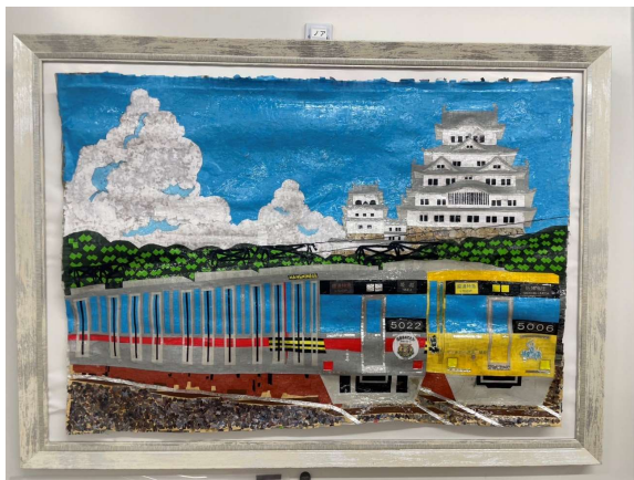
作品名 姫路城と入道雲をもとに走る 作者名 黒川篤史 (くろかわあつし) サイズ 500×650mm